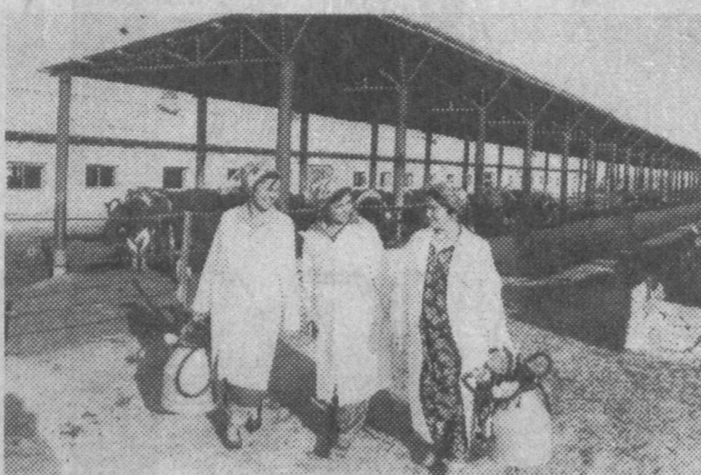
Фото Бахрома Тураева. (У.А.)

ведут свое дело работники молочно-товарной фермы ширкатского хозяйства "Фархат" Кавас-тского района. Хозяйство считается одним из показательных в Сырдарьинской области.