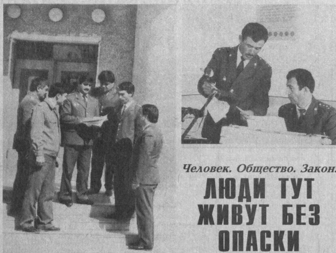
Человек. Общество. Закон. ЛЮДИ ТУТ ЖИВУТ БЕЗ ОПАСКИ

Если вечером выходит на лавочки старики, играют допоздна малыши на улицах, и матери не очень беспокоятся, звенит где-то девичий смех, - эти признаки стабильности, спокойствия в городе или поселке говорят об успешной работе милиции убедительней всякой статистики.