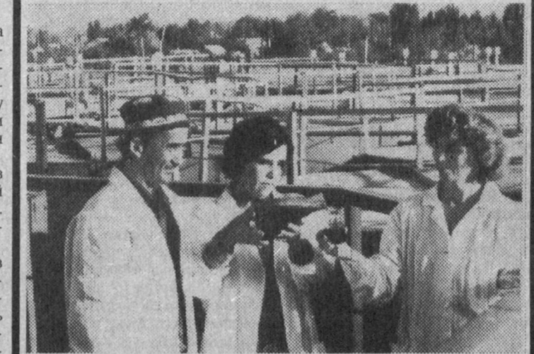
ФОТО - ФАКТ

Красногвардейский комбинат по производству вина и 5 винных заводов Будунгурского района поставляют в республику значительную часть произведенной продукции. В этом районе на площади 6600 гектаров выращивают 57 тысяч тонн винного винограда.