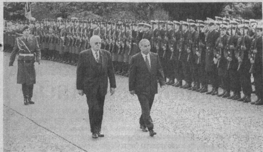
НА СНИМКАХ: церемония официальной встречи Президента Республики Узбекистан И. А. Каримова в резиденции "Вилла Хаммершмидт"; во время встречи Президента Ислама Каримова с председателем бундстага ФРГ Ритой Зюсмут.