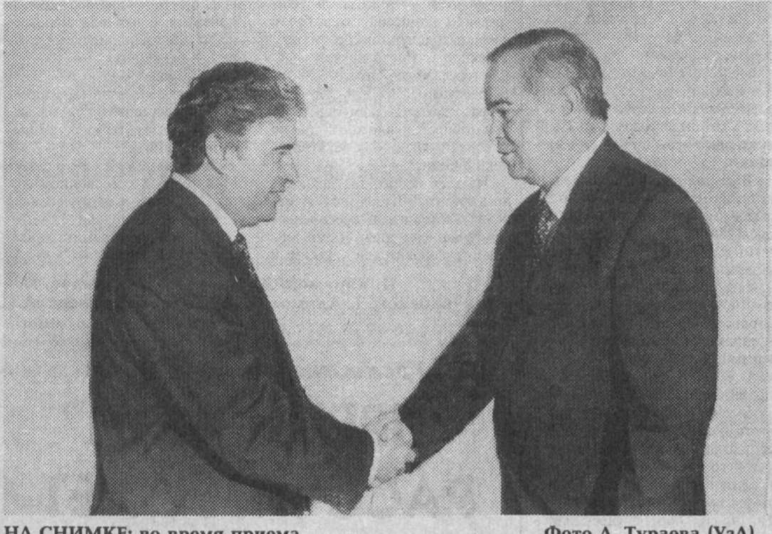
НА СНИМКЕ: во время приема.

в парниковом хозяйстве. Сюда из Швейцарии уже доставлен посевной материал, скоро поступит современная техника и оборудование. И.Худойкулов. Корр. УзА.