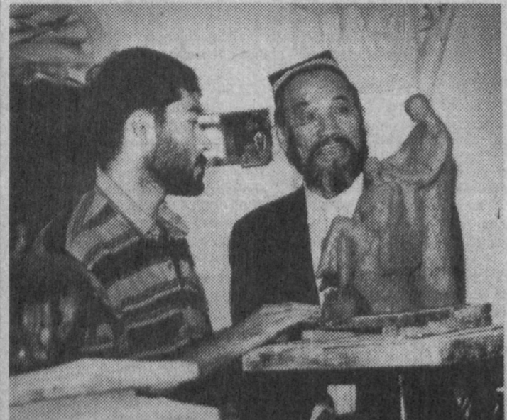
Ташкентскому государственному институту искусств имени Маннона Уйгура пятьдесят лет