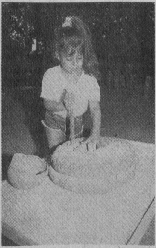
мачивают водой и смешивают с соломой, а затем формируют продолговатые "кирпичи". Дети лепят и глиняные тарелки, чашки и скульптуры. Им предлагают самим находить и активно использовать подручные природные материалы. Четырехлетний малыш лепит ежика с колечками из прутиков.

ГАЛИЛЕЙСКАЯ ДЕРЕВНЯ ОТКРЫТА ДЛЯ ПОСЕТИТЕЛЕЙ С ИЮНЯ ПО СЕНТЯБРЬ. ЗДЕСЬ БЫВАЕТ МНОЖЕСТВО ШКОЛЬНИКОВ, ПРИЕЖАЮТ ГРУППЫ РЕБЯТ ИЗ ЛЕТНИХ ЛАГЕРЕЙ, А ПО ВЫХОДНЫМ - РОДИТЕЛИ С ДЕТЬМИ.