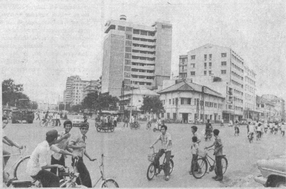
По городам мира

тивостоянии с президентом-демократом Биллом Клинтонном, отстаете далее в опросе общественного мнения, проведенном совместно газетой "Нью-Йорк таймс" и телекомпанией Си-би-эс, преимущество генерала будет по-прежнему; 50 процентов против 38 процентов. Пауэлл еще не объявил официально о вступлении в президентскую предвыборную гонку, хотя уже неоднократно намекал на такую возможность.