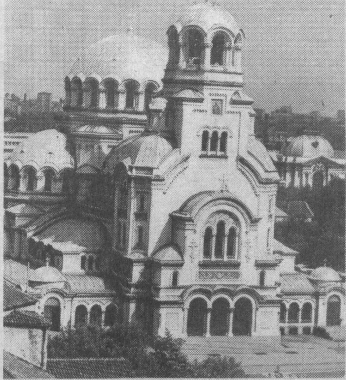
ПО ГОРОДАМ МИРА

Затопленные участки суши, разрастающиеся пустыни, страдающие от голода люди - такую апокалиптическую картину будет представлять собой наша планета через каких-то 100 лет, считает группа ученых из 30 стран мира, доклад которой был распространен в Вашингтоне.