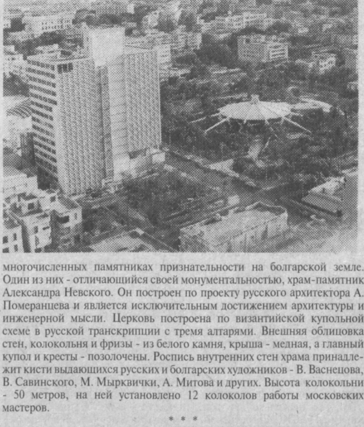
Гавана - крупнейший промышленный, культурный и научный центр Кубы.

В сражениях за освобождение Болгарии от турецкого ига смертью храбрых пали 110 тысяч русских воинов, подвиг которых увековечен в