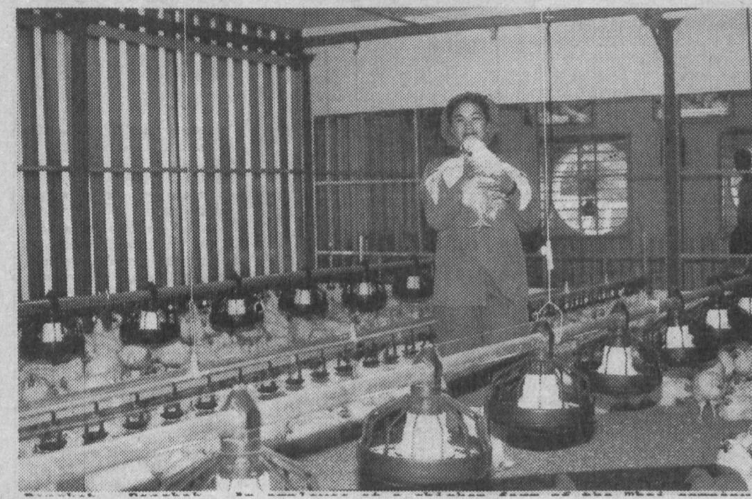
Банкок. Работница куриной фирмы компании Тхай Чарп Покпант - одна из 80.000 сотрудников фирмы, работающих по всему миру на крупнейшую в Таиланде мультинациональную корпорацию.