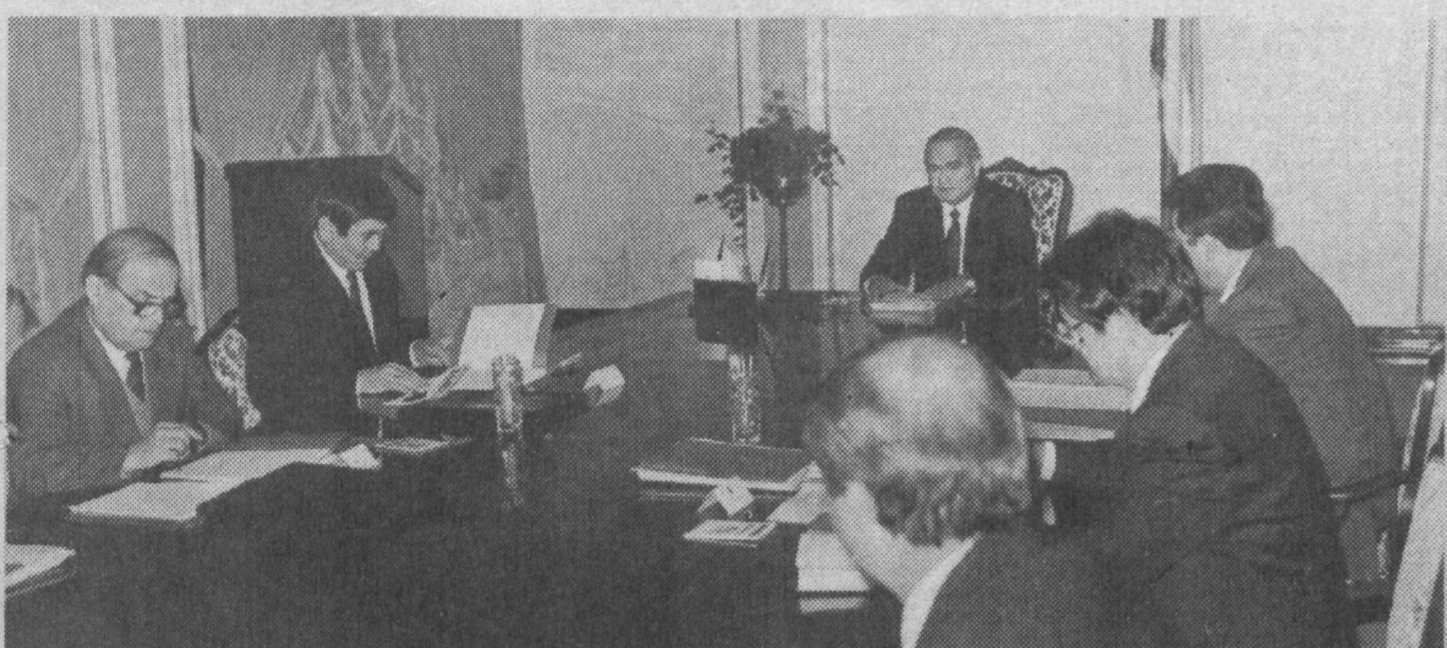
НА СНИМКЕ: во время очередного заседания Совета национальной безопасности.

Соб. корр. "Правды Востока". Бухарская область.