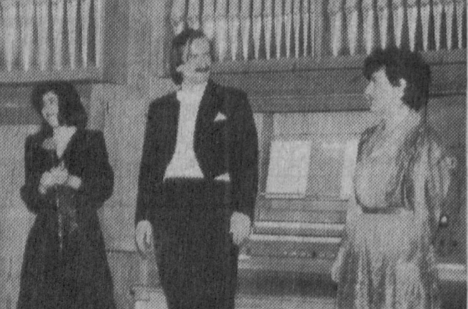
И ВНОВЬ ЗАЗВУЧАЛ ОРГАН