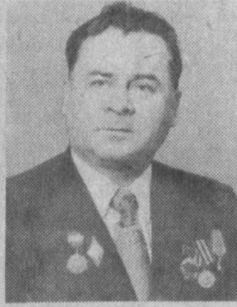
Штрихи к портрету