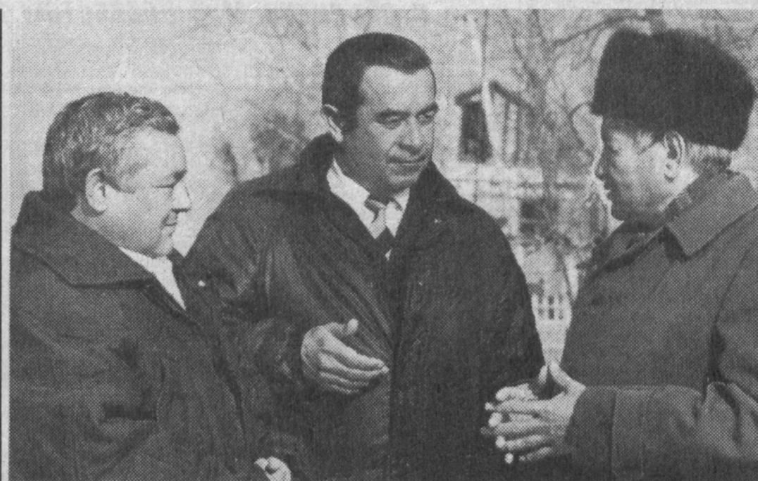
Земля и люди