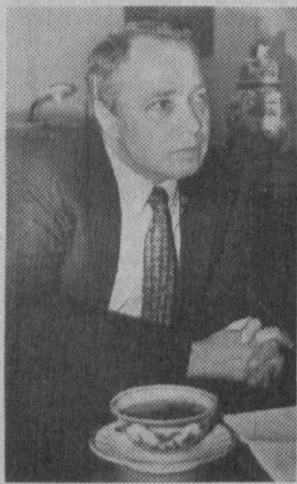
Филипп Филиппович, председатель избирательной комиссии Государственной Думы России. Как вы можете их охарактеризовать?

На вопросы "ПРАВДЫ ВОСТОКА" отвечает Чрезвычайный и Полномочный Посол России в Узбекистане Ф. Ф. СИДОРСКИЙ