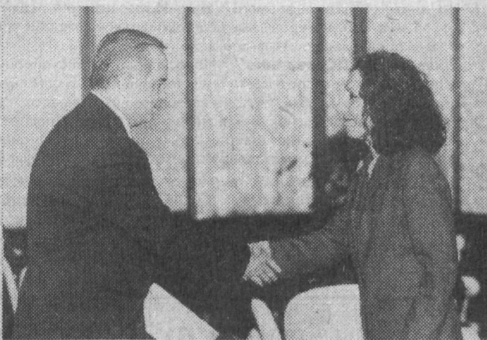
Чрезвычайный и Полномочный Посол Итальянской Республики в Республике Узбекистан Иоланда Брунетти Готцц вручила Президенту Республики Узбекистан Исламу Каримову верительные грамоты.

Узбекистан и Индонезия находятся далеко друг от друга, но у наших народов много общих традиций, - сказал Президент Ислам Каримов. - Дальнейшее развитие