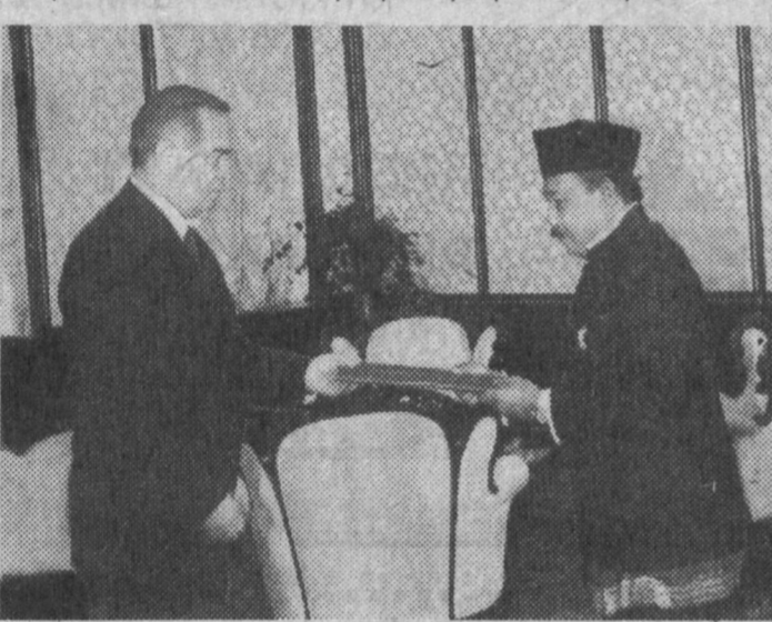
Чрезвычайный и Полномочный Посол Республики Индонезия в Республике Узбекистан Соекдари Хонгвонгсо вручил Президенту Республики Узбекистан Исламу Каримову верительные грамоты.

сотрудничества между двумя государствами может и должно служить интересам наших народов.