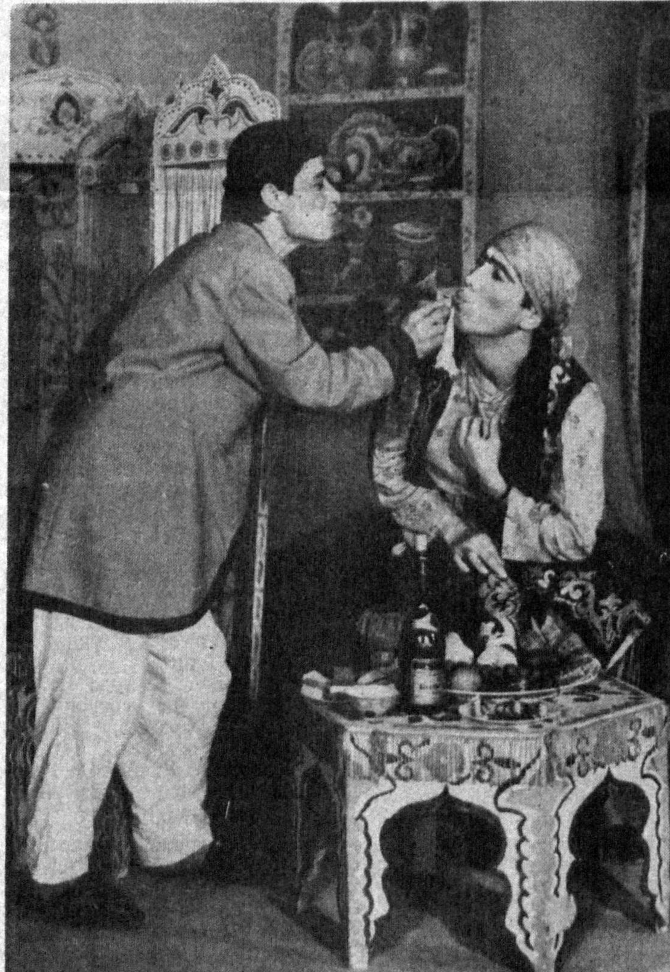
Қарши шаҳрида «Мулоқот» театри иш бошлаганига ҳали кўп вақт бўлмади. Аммо қисқа муддат ичиде бу ёш жамоани шўхрат чет элларга ҳам ёйилди. Улар кетма-кет икки марта Марказий Осн театри «Наврўз» кўригини совриндор бўлишди. Италия, Бельгия ва Франция каби қатор мамлакатларда ижодий сафарларда бўлиб қайтишди. Яқинда театр жамоаси Бельгия давлатида иккинчи бор тақлифнома олдилар. Бу уларнинг санъати ҳориқлик томошабиларга ҳам манзур бўлаётганлигини далиллади. СУРАТДА: Ҳанза Ҳакимзода Нийзийнинг «Жонига бордим бир кеча» сахна асаридан кўриниш.

монидан республикамизда жойлашган 350 дан ортиқ йи-рик корхоналар текшириб чи-қилиб, уларнинг натижасида 200 дан ортигининг фаолияти вақтинча тўхтатилиб қўйилди. Енги хавфсизлигини таъ-минлаш, керакли чора-тадбир-ларни қўлаш масалалари ма-ҳаллий ҳокимиятлар томонидан кўриб чиқилиши тавсия этилган. Енги йилнинг олдини олиш мақсадидида республика ва маҳаллий оёнан маҳонлар-да 134 ўрнату, радио ортали 2,5 минг эшиткичлар олиб борилад, матбуотда 1,5 минг-га яқин мақолалар босиб чи-қарилади. Давлат ёнғин назорати ҳо-димлари томонидан 71,5 мингга раҳбар ва лавозимли шахсларга ёнғинни олдини олиш талаб ва қондаларни бузганликлари учун жарима солинди. 20 мингга ёнғин чи-қиб хавфи бўлган корхона, муассаса, ташкилотлар ишга тўхтатилади. 76 минг олада электр асбоб ва қуримлар-ни носозлиги туфайли улардан фойдаланиш таъқиқ-ланди. Енги хавфсизлигини таъ-минлаш ишларини мунта-зам бажармаётган, қондалар-ни қўлол равишда бузётган 40 мансабдор шахс Ўзбеки-