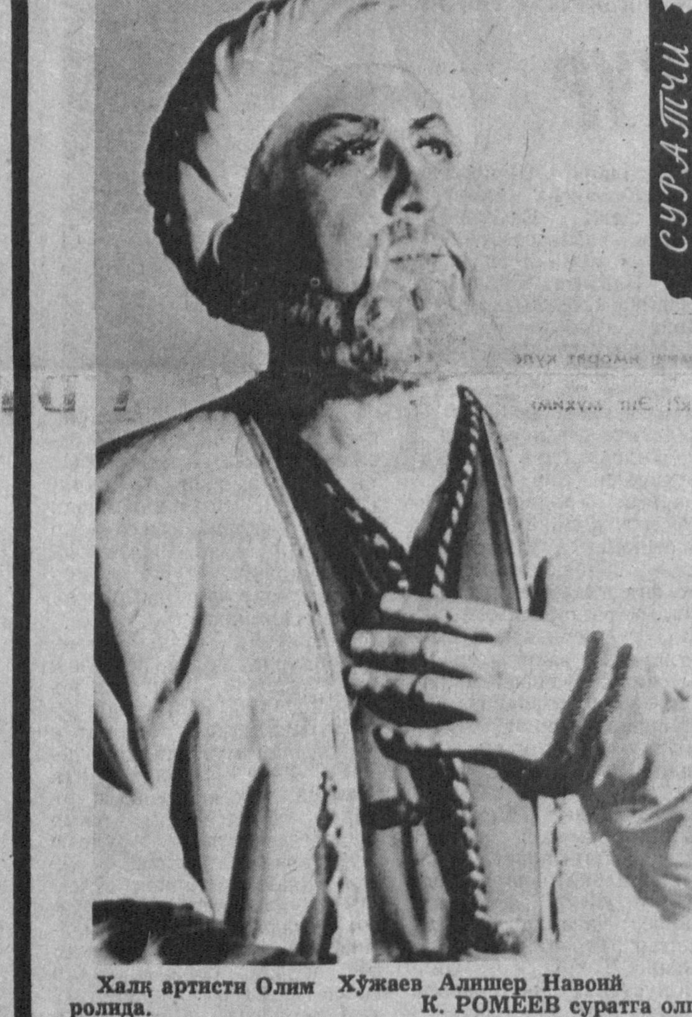
Халқ артисти Олим Хўжаев Алишер Навоий ролида.

Спектаклда шитроқ этган ҳар бир актёрнинг ўз ижро услуби ва ўзига хос истеъдоди бор.