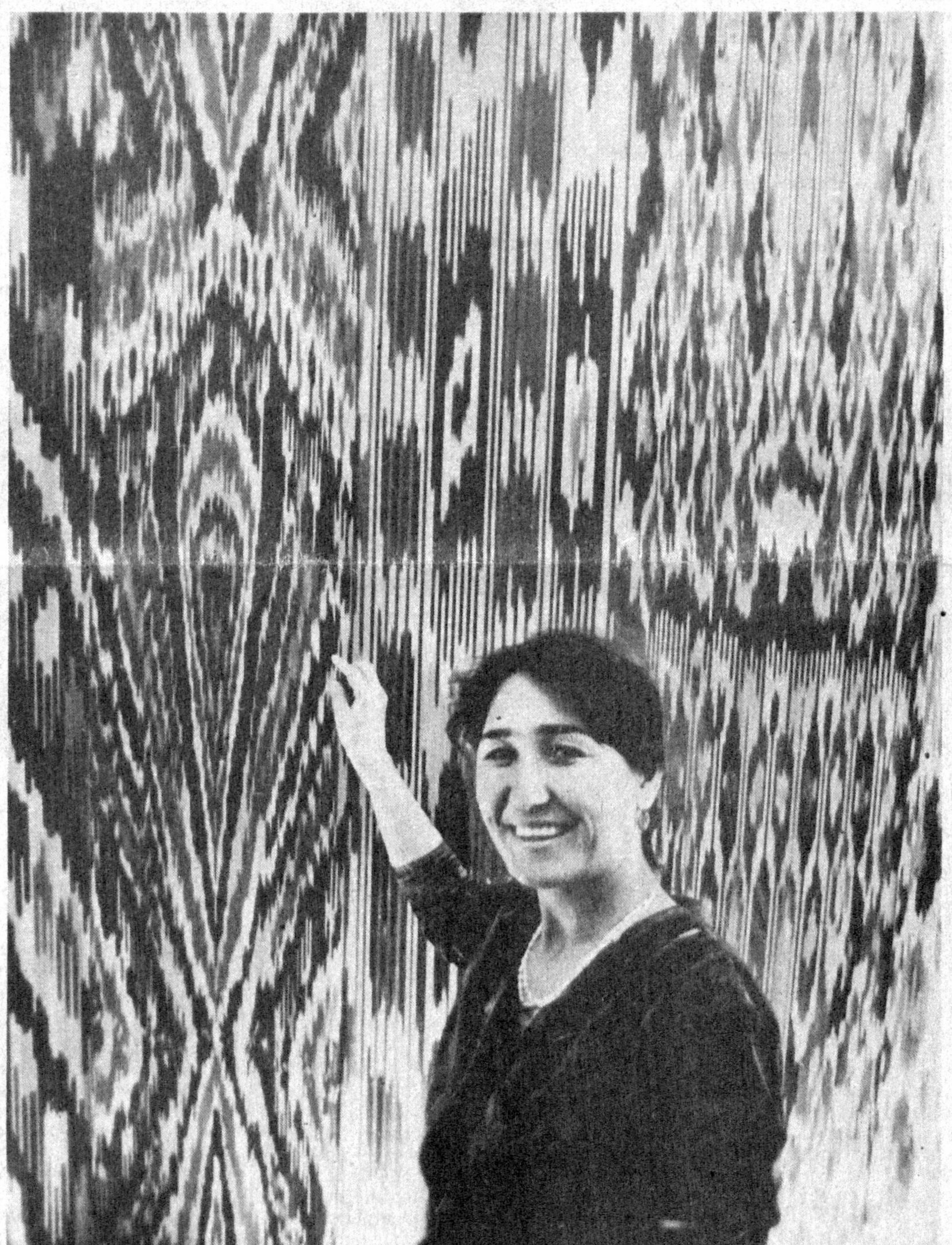
Ўзбекининг миллий атласлари таърифида муҳтож эмас. Дунёнинг бир бурчагида атлас қийиб юрган ўзбек қизидан ҳеч ким: «Миллатингиз нима?» деб сурамайди. Нарри борса: «Сиз ўзбек-а?», дейишади. Шаҳрихонлик атласчилар аҳолини ҳеч қандай узилишларсиз ўз маҳсулотлари билан таъминлаб турибди.

Иш шу билан тўхтаб қолмади. У Туркистонда Ўзбекистон Республикасининг Президенти Ислам Каримов билан учрашган пайтда Ўрта Осиё ҳудудда туркизабон мамлакатларнинг сифат жиҳатдан янги ҳамдўстлигини тузиш вақти келганлигини алоҳида таъкидлаб ўтди. Бу қуруқ гап эмаслигини кўрсатиш учун қадимий яхши ағъанага кўра, Ўзбекистон раҳбарига зотдор тулпорни совға қилди. Ўша вақтда бу гап тарих тараққиётининг мантиқий, қонуний йўли сифатида кутиб олинган эди. (Давом 2-бетда).