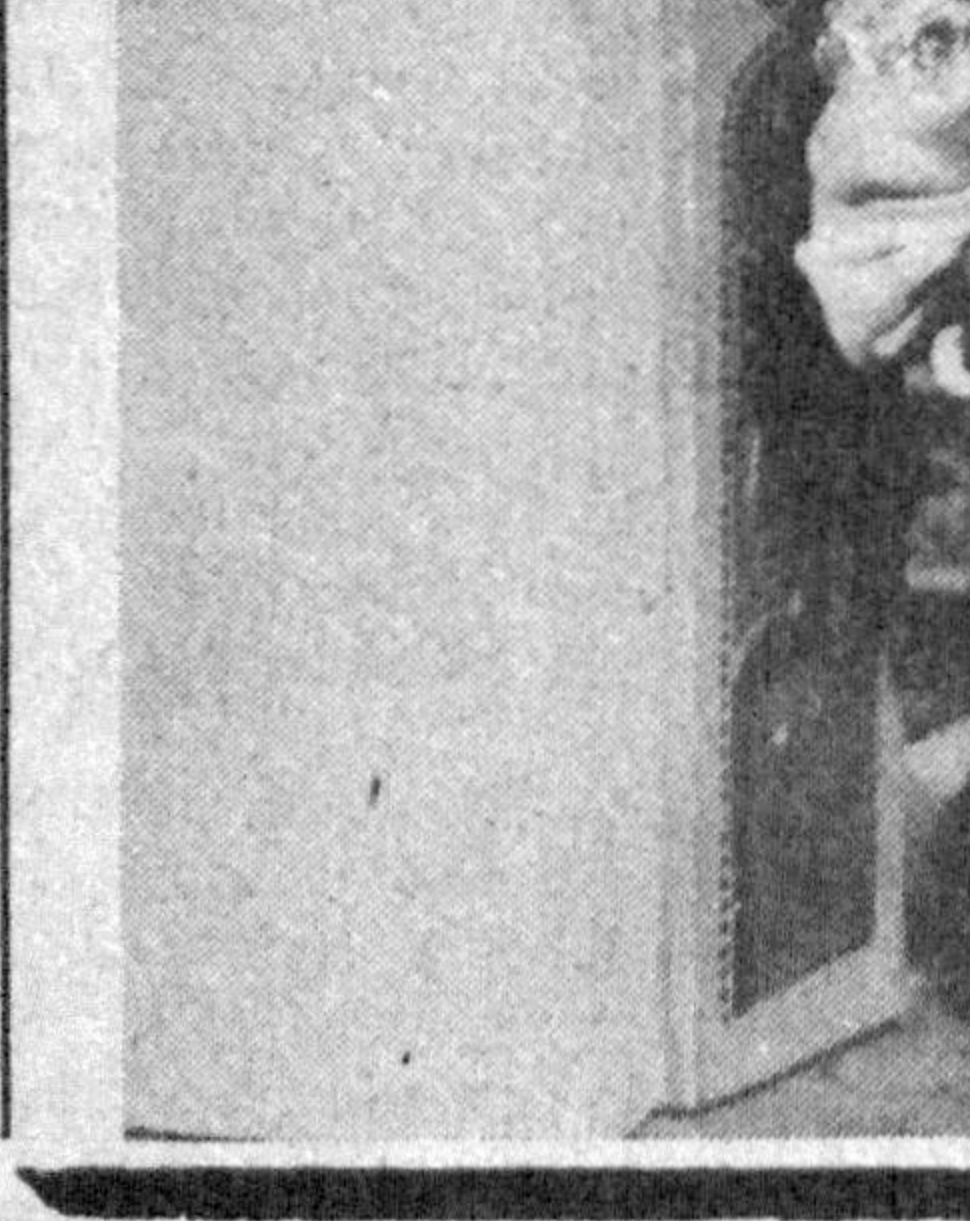
«Подшоҳнинг ҳукмига қўра», деган мултыфильм ҳам болалар томонидан илқ кўриб олинади, деб ўйлаймиз. Ундаги воқеалар оддий. Ҳақ ўз ҳукмидорига нисбатан қандай муносабатда? Шоҳ уни билмоқни истайди ва одамлар гавжум бўлган бозорга боради. У ёни... фильминг тўлиқ томоша қилганингизда маълум бўлади.