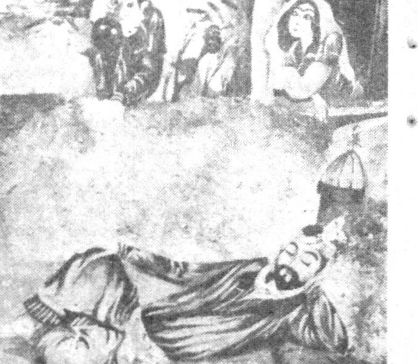
Ажойиб режиссёр ва расом Мавзур Маҳмудов томонидан суратта олинган «Синдбоднинг саргузаштлари» деб номланган фильм машҳур «Минг бир кеча» китобидан ўрин олган бир эртак ҳақида ҳикоя қилади.