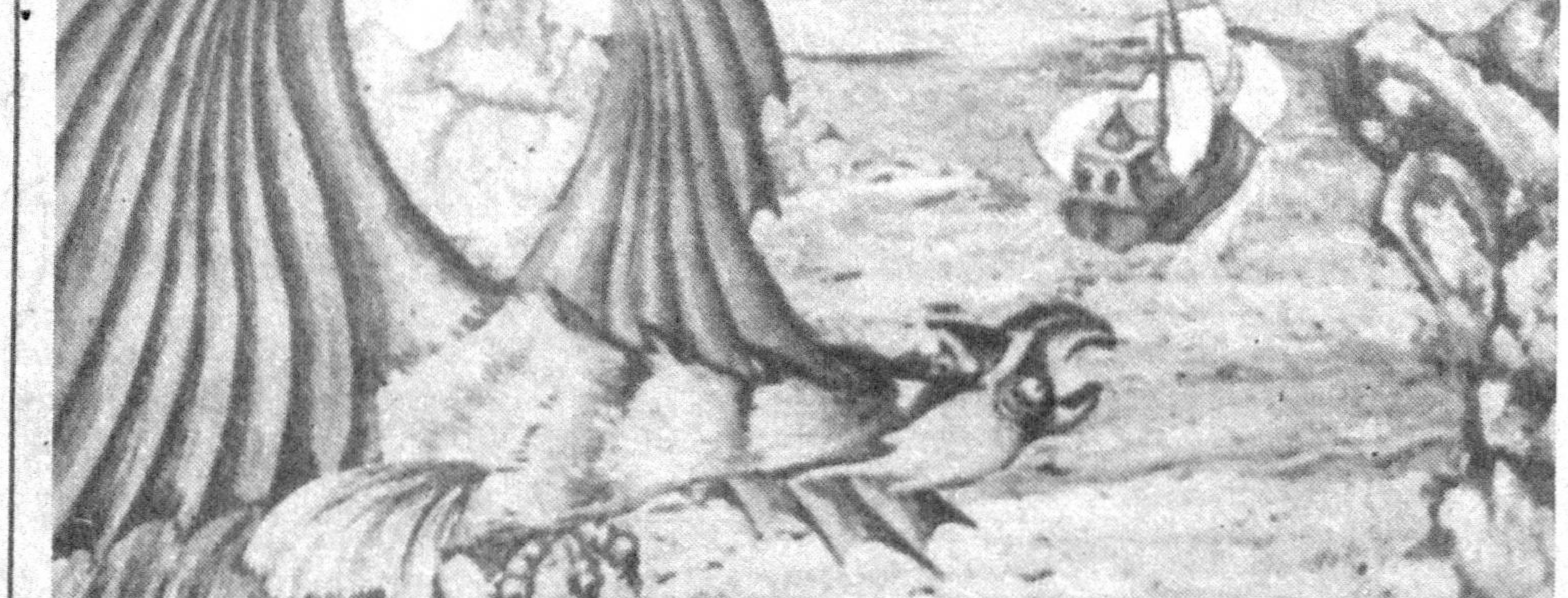
«Ўзбекфильм» акционерлик корхонасига қарашли мултыушима ижодий жамоаси болалар учун янги фильмлар яратишга бел боғлашди. Шу зағда қадар ўз эртак ва ривоятларини асосида ўзбек тилида суратта олинган мултыфильмлар йўқ, деб нолиб юрардик. Зора, энди миллий маданиятимиздаги ана шу кетикни тўлдирди.

— Тўғри, адвокатлар адалатни ҳимоя қиладилар. Аммо, кўпчилик уларнинг эътирозлари инобатга олинмайди. Бунинг сабаби нимада? Қонунийликнинг бўлишидами? Ёки адвокатларнинг имкониятлари чеклангандами?