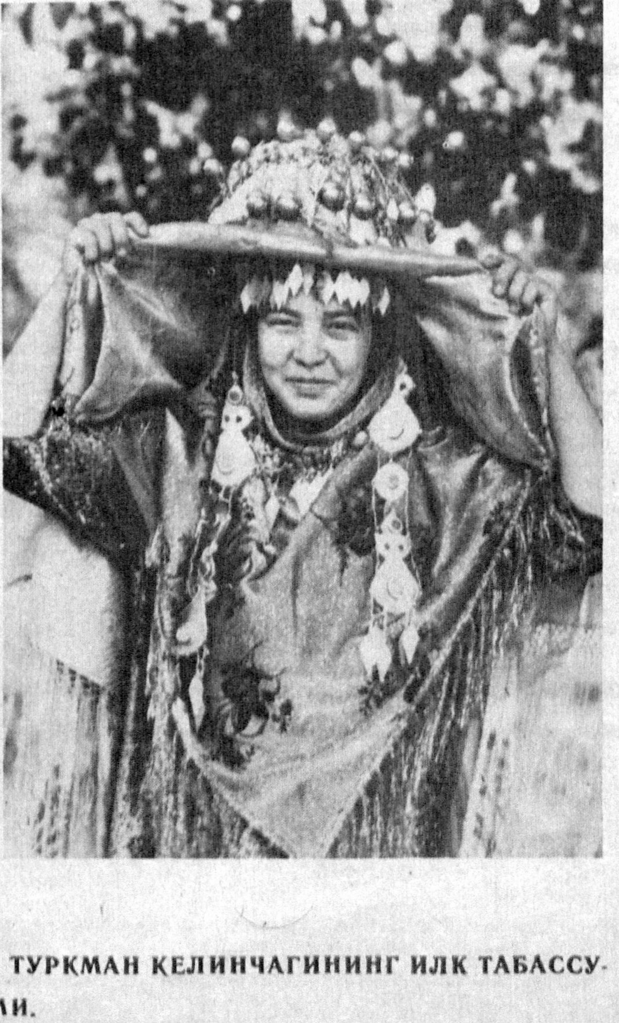
ТУРКМАН КЕЛИНЧАГИНИНГ ИЛК ТАБАССУМИ.