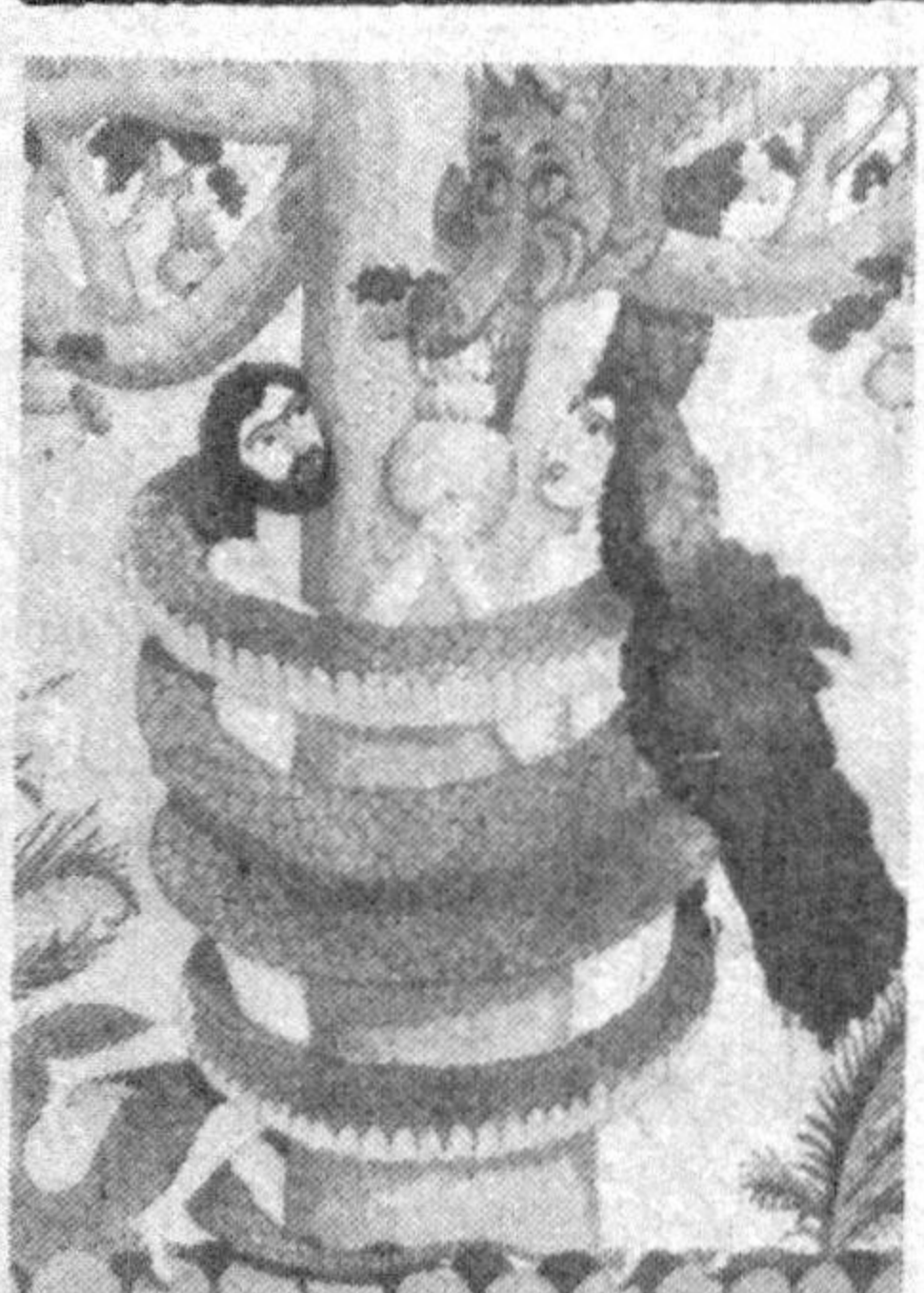
«Подшоҳнинг ҳукмига қўра», деган мултыфильм ҳам болалар томонидан илқ кўриб олинади, деб ўйлаймиз. Ундаги воқеалар оддий. Ҳақ ўз ҳукмидорига нисбатан қандай муносабатда? Шоҳ уни билмоқни истайди ва одамлар гавжум бўлган бозорга боради. У ёни... фильминг тўлиқ томоша қилганингизда маълум бўлади.