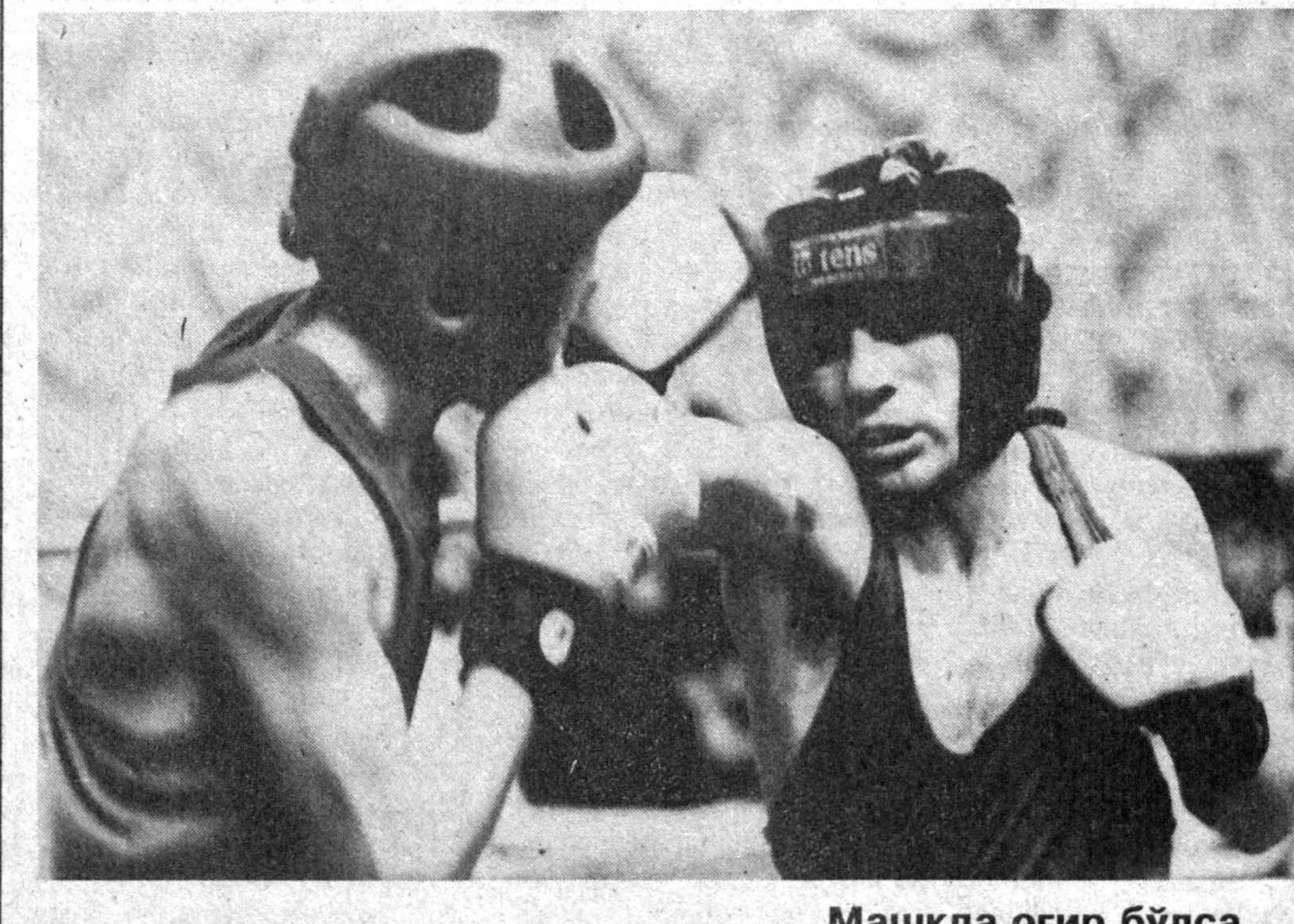
Машқда оғир бўлса...

— Демак, ҳижроннома ёзганлигингиздан пушаймон қилган вақтларингиз ҳам бўлган? — Кўп бўлган... — Ўз шеърларингиздан лаззатланган, фахрланган пайтларингиз-чи? — Албатта. Аввало бу шеърлар мени сирдошим бўлиб ўтувган, ҳалоскорим бўлиб турли вазасалардан асраган, мураббия бўлиб тарбиялаган, посбон бўлиб руҳини, ахлоқини кўрикланган! Тушқунлик бағридан нур бўлиб еркин ўқуларни қўрсатган! Ҳатто қўлдамда ҳолатлар катта-кичик давраларда менга тоғдек гурур ола этган. Келинг, бугун шеър ёзодмай