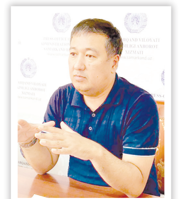
Жасур РИЗАЕВ, Самарқанд давлат тиббиёт институти ректори:

Касалликни даволаш, пандемия даврида аҳолига тўғри тиббий маслаҳат бериш мақсадида институтимизда 2000 га яқин мутахассис, 229 нафар тор соҳа мутахассислари қайта тайёрланди. Захира кадрларни тайёрлаш учун 72 соатлик ўқув курслари ташкил этилди. Вилоят ҳамшираларни қайта тайёрлаш марказида 900 нафар ҳамшира тайёрланяпти.