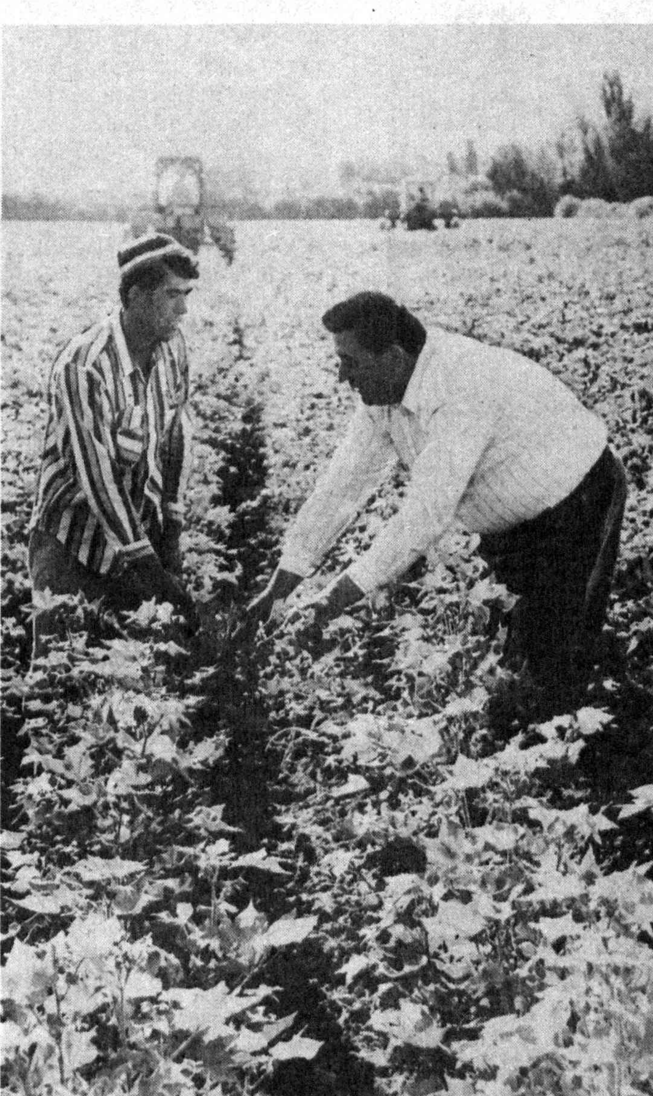
Уқув семинари давом этмоқда. (У.А.)