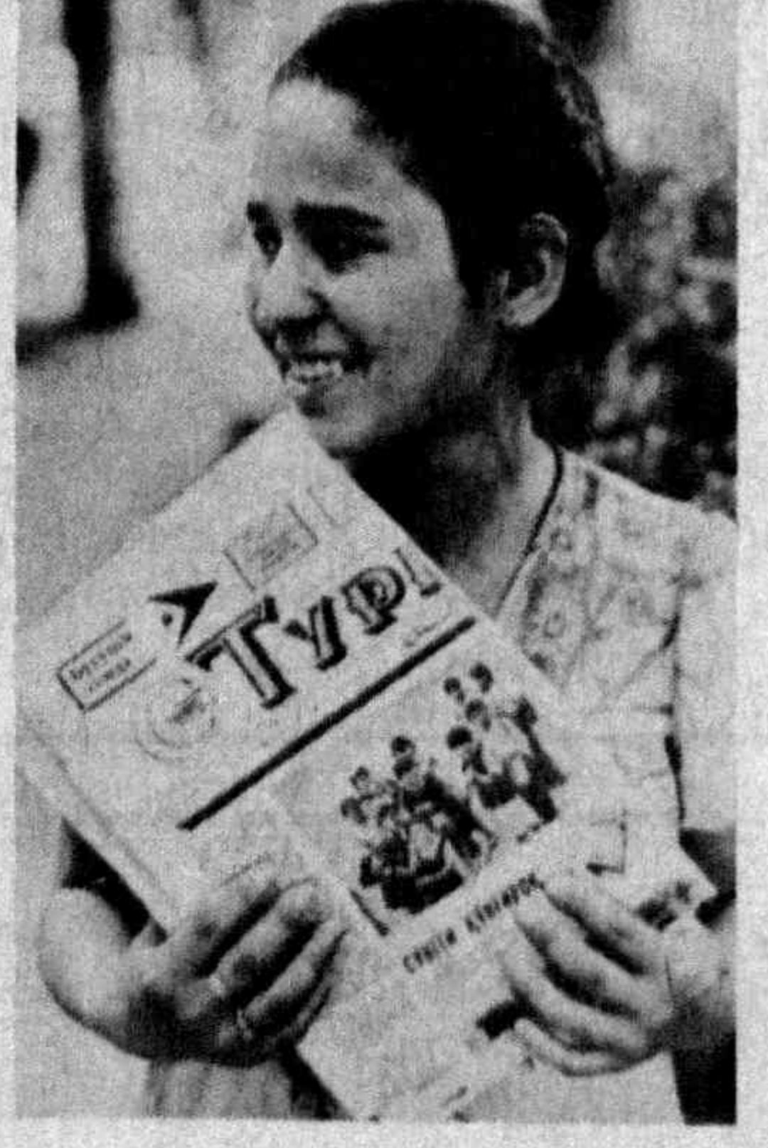
«Туркистон»ни севиб ўқийман