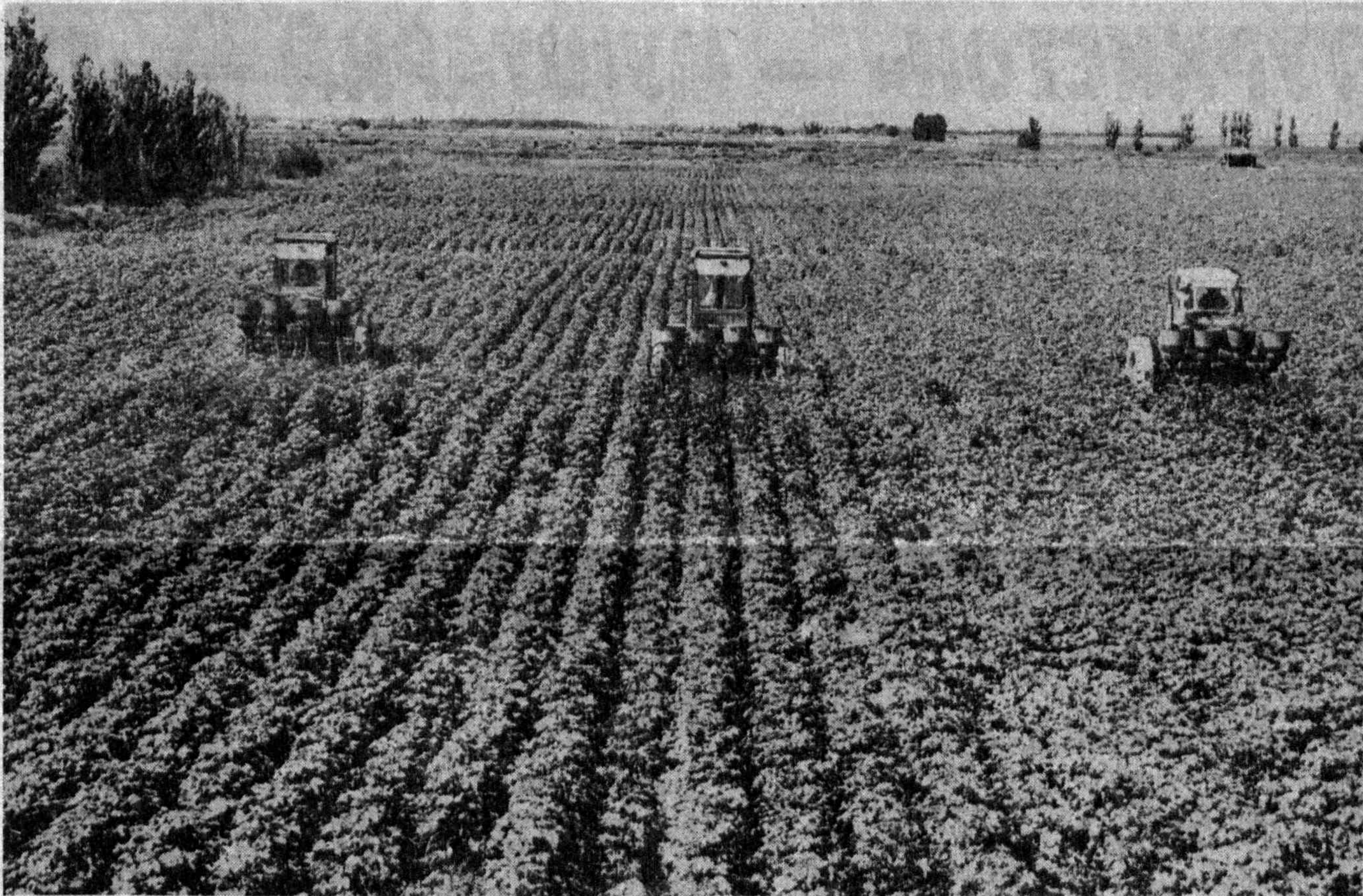
Бепоеён далалар, файзли далалар...