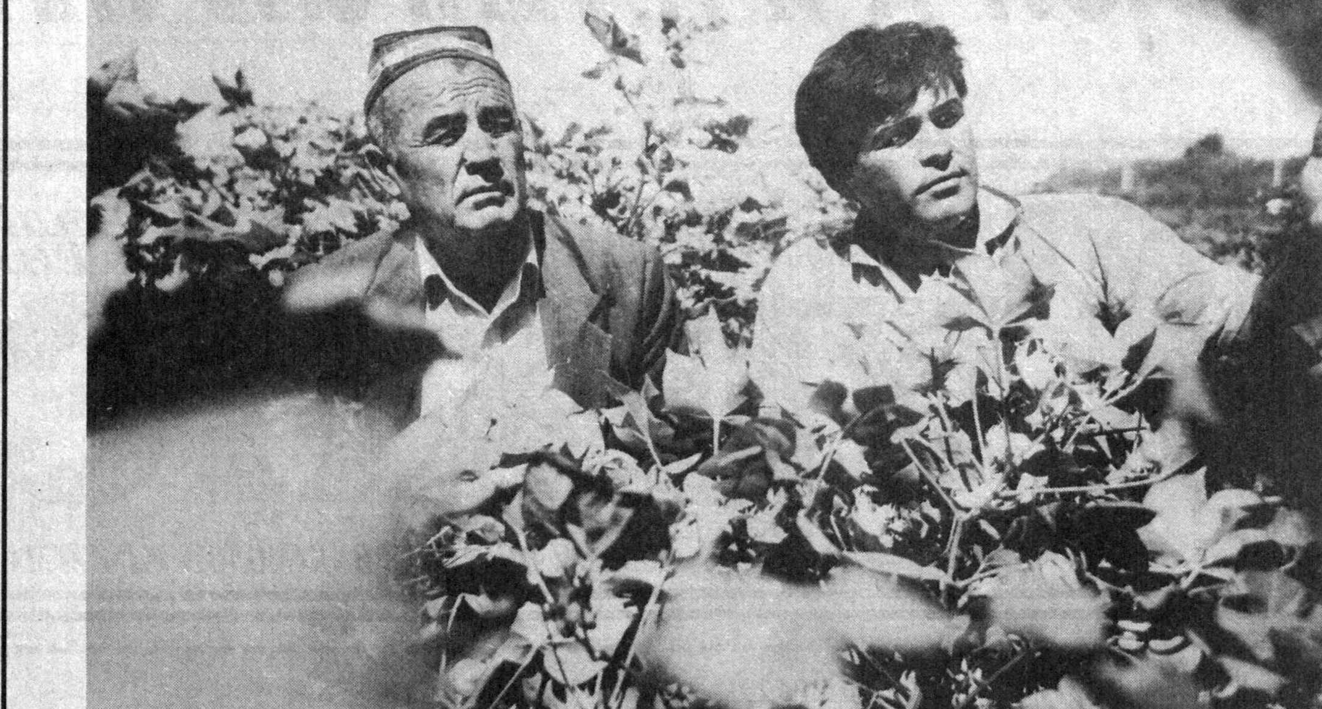
Бухоро вилояти Қоровулзор тумани «Пахтакор» жамоа ҳўжалиги пахтакорлари бу йил «Бухоро — 6 нави» гўза парваринида кўла уришган. Жамоа ҳўжалиги деҳқонлари бу йил ҳосили 25 центнердан 35 центнерга кўтаришни режалаштиришди.

— Мазмуни сўхбатингиз учун ташаккур! Т. АКБАРОВ