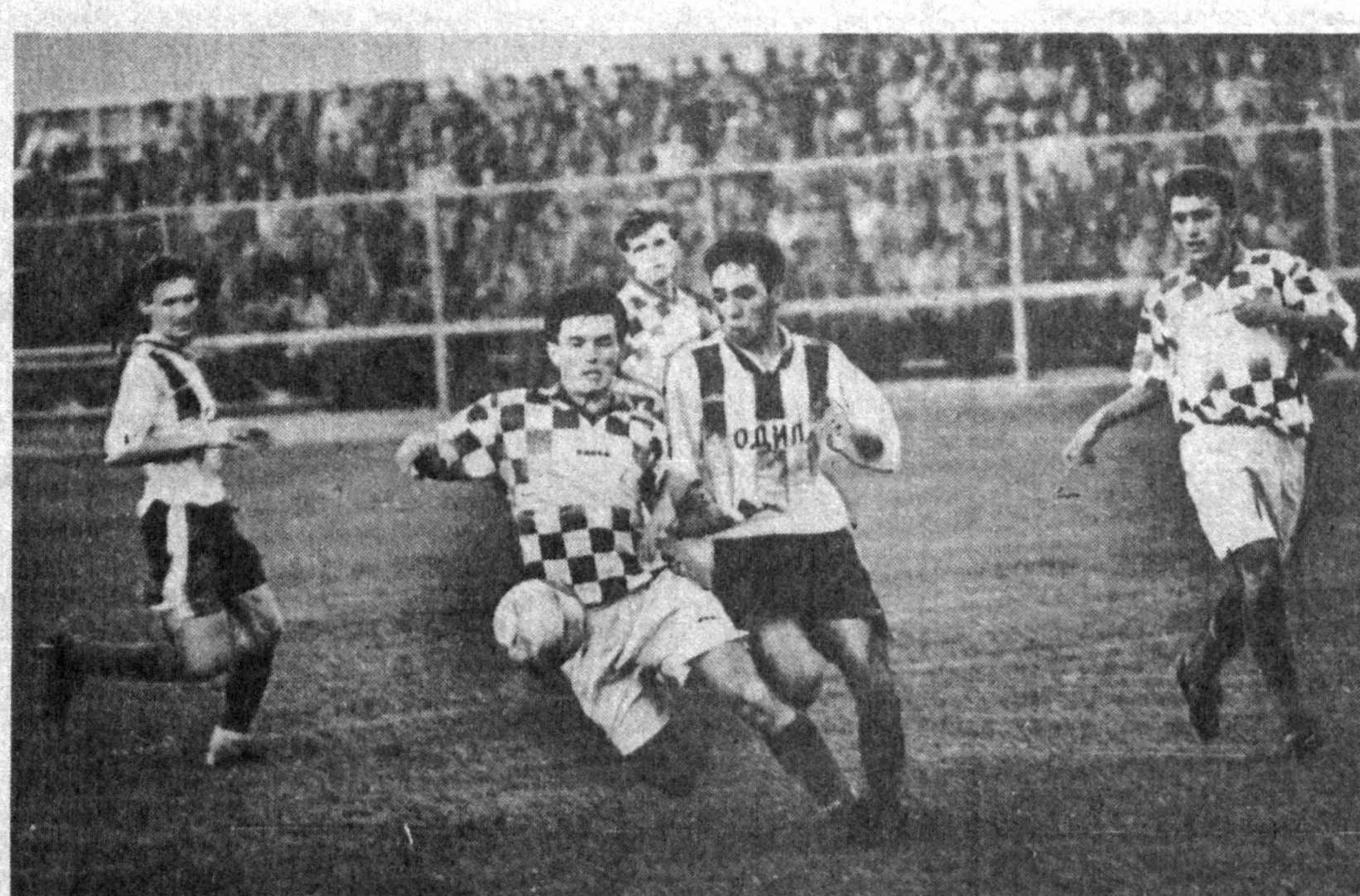
Энг яхши ҳимоя — ҳужум!

Ва ниҳоят қадамлар масаласи ҳам яна бир муаммони келтириб чиқмоқда. Аникроги, нега Марказий Осиё жамоалари бир-бири билан мусобақалашганда, албатта шу минтақаларда ҳам тайинлашни керак? Бу муҳим саволларга жавоб топишда ҳам унинг натижасига шубҳа билан қараши оқиб келатганининг бир неча бор гувоҳи бўлди.