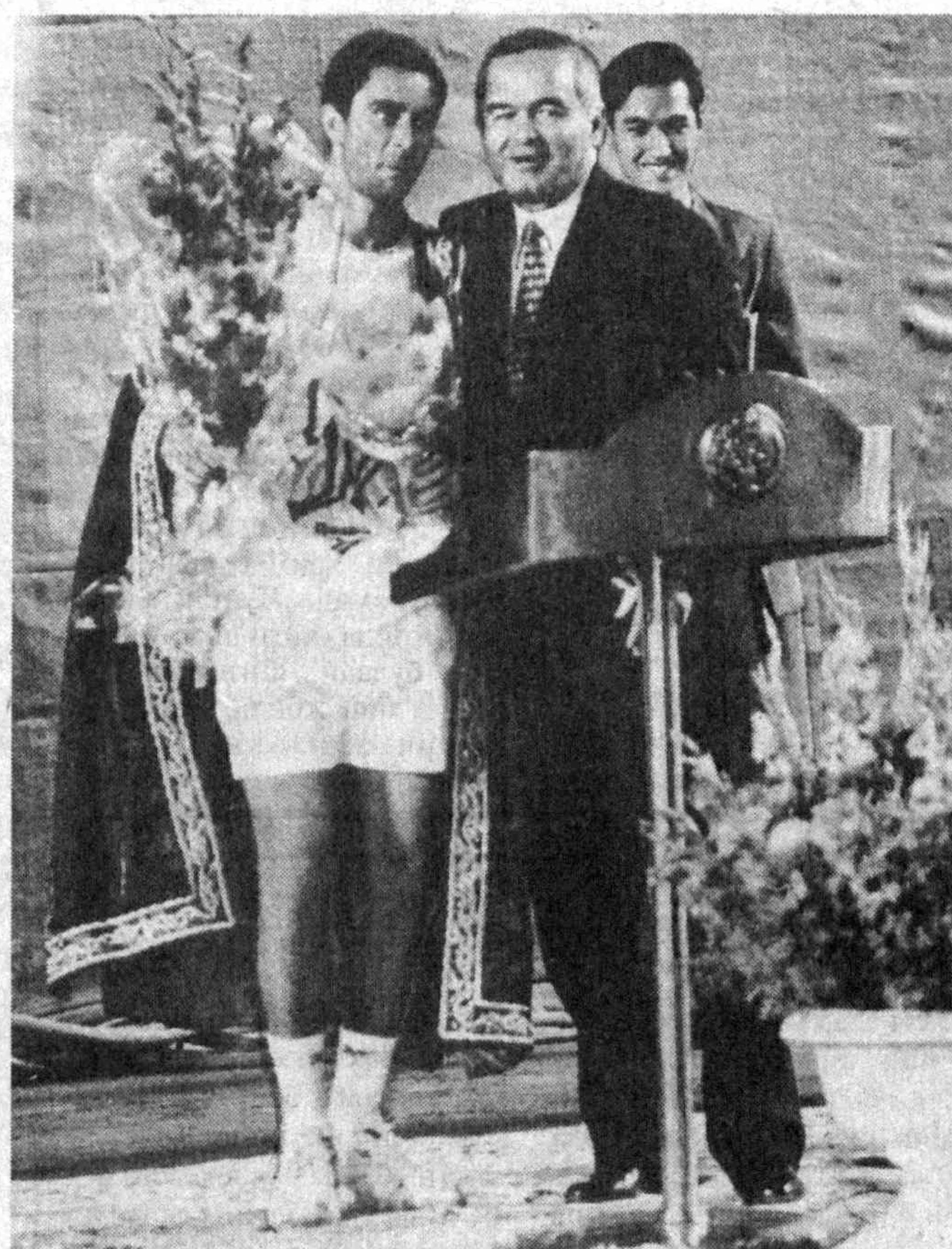
Ислам Каримов ва бошқа раҳбарлар теннис мусобақасида.

Ташкилот қораларида бир ҳафта давом этган мусобақалар ҳаяжонли даҳзаларга, гузал уйинларга бой бўлди. Ишқибозларимиз Феликс Мантйя, Андрей Черкасов, Маргин Хромик, Ларс Райман, Даниэль Балдуччи каби таъини ракетка усталарининг ажойиб