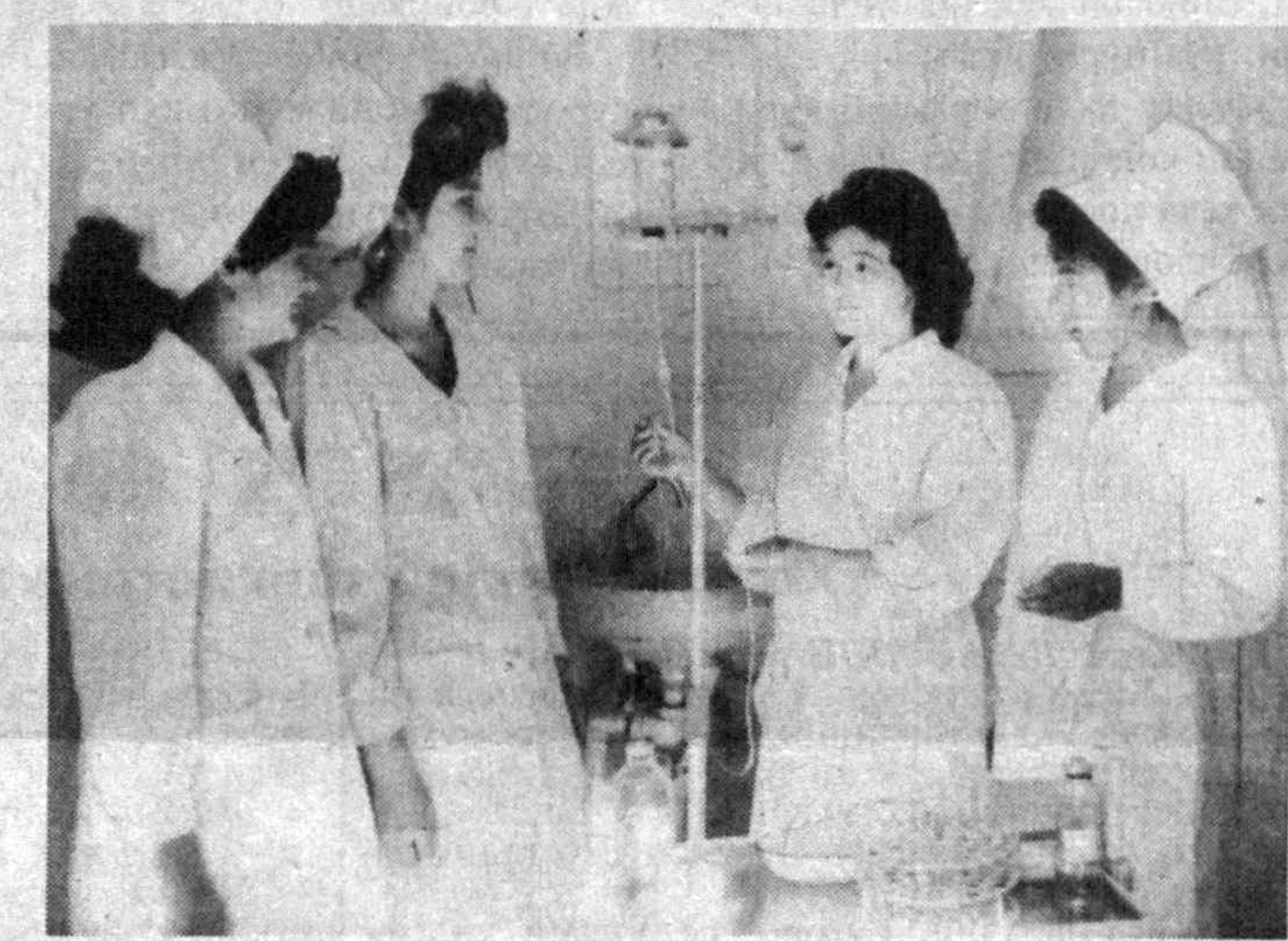
Талабалик — олтин даврим