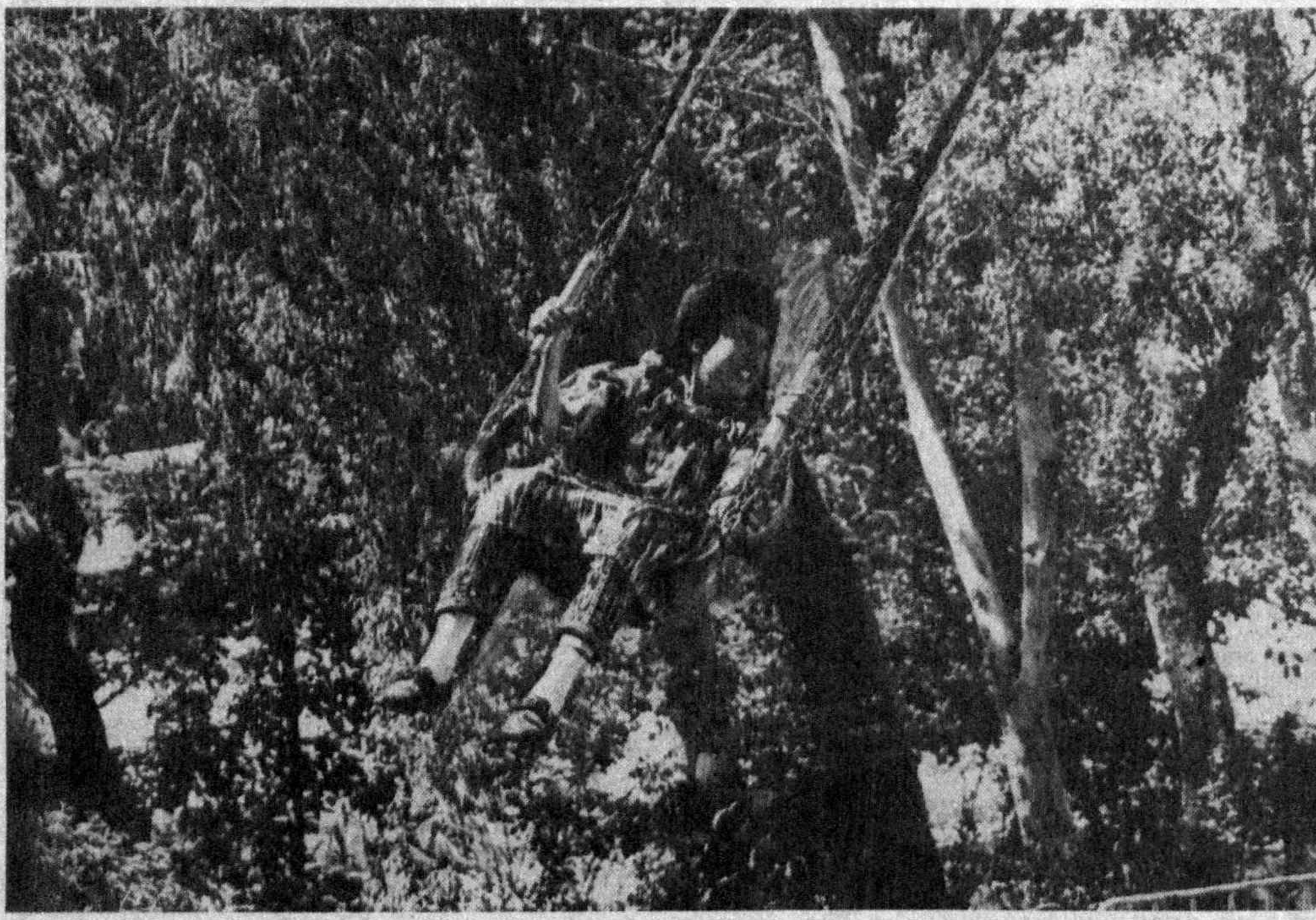
Аргамчи учиб-учиб, Дил ҳам учгудек бўлар.