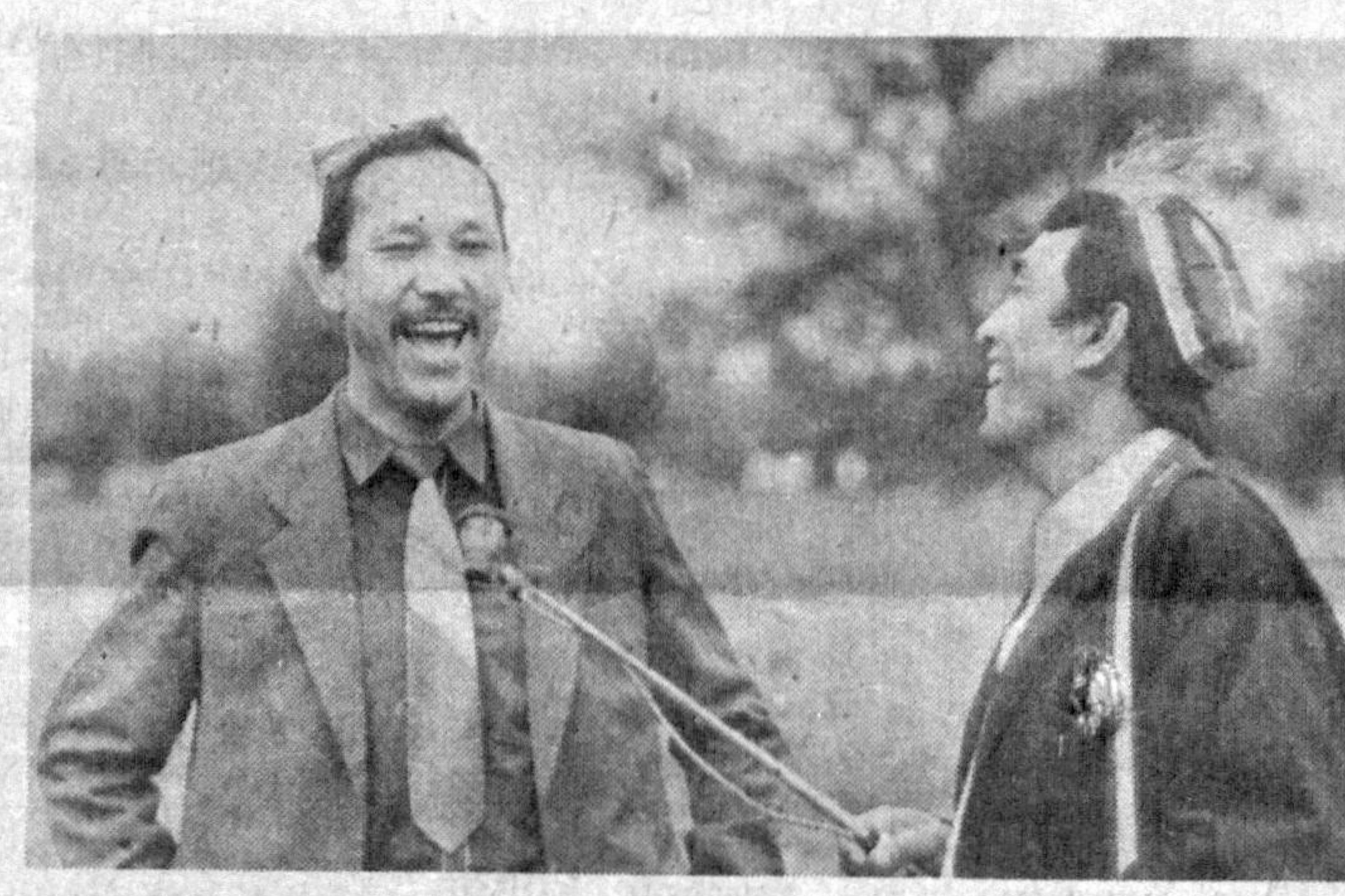
...«Стой куда идёшь?» деб бирларга кераги битта ин-тервью оли интервью оли-верасанми? Агар, шакар ё совиу сураш-ганида нима қилардики?