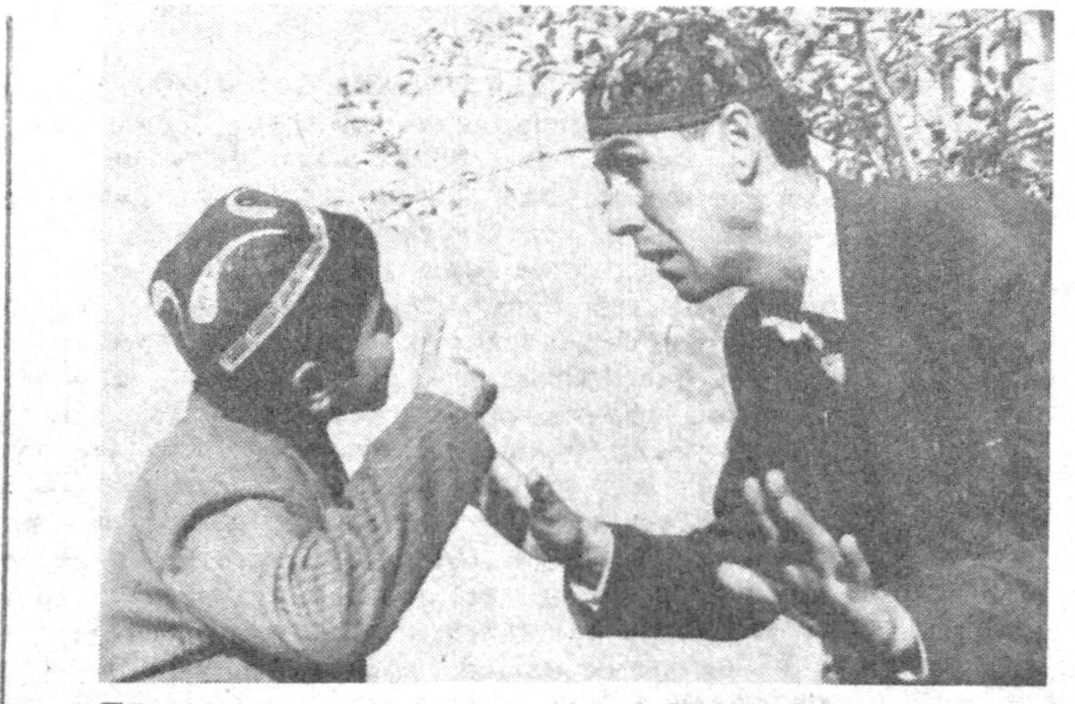
...Духтирга кетдим деб яна гиз Никульмита ўхшаб қолга-ичибсиз-а! Сездим, башаран-нидан! — Кўй, ўғлим...

ЕКИ «КЎВНОҚЛАР ВА ҲАНДАЛАК ПУРУШЛАР» КЎРСАТУВИНИНГ «ГАЗЕТНИЙ ВАРИАНТИ»