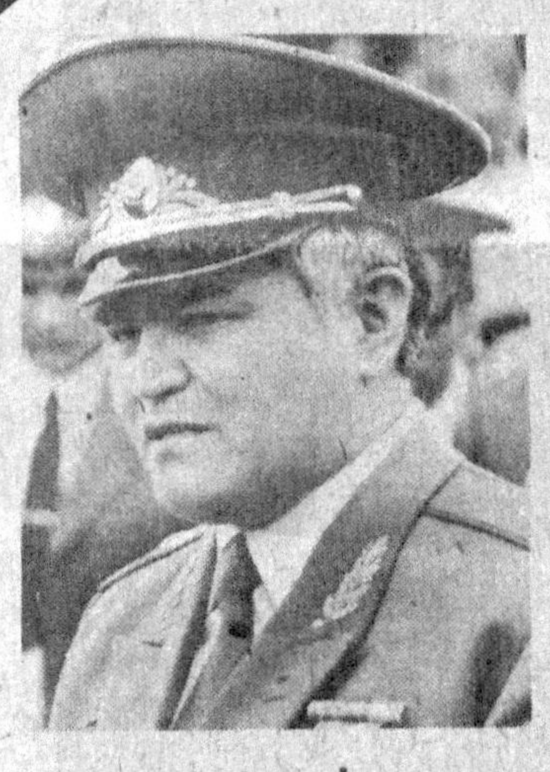
дан 17 гаца дилдан суҳбат уюштирилди.

Ўзбекистон Давлат божхо-на қўмитаси республикамиз-дан энг кенга тузилмадан-дан бири. Ленин шундай бўлса ҳам, унда катта бўла-маган иш қўмитанинг иш-лари салмоқли бўлаётди. Бир-гина ўтган йилнинг ўзида божхона ходимларининг сатби ҳаракатлари эвазига республикамиздан ноқонуний равишда олиб чиқиб кетила-ётган 1 миллиард 251 мил-лион сўмлик мол ушлаб қо-линди. Бу йилнинг беш ойи мобайнидаги кўрсаткич бу-дан ҳам юқори 5 миллиард сўмга яқин моллар қону-ний эгалари — халқимизга қайтарилди.