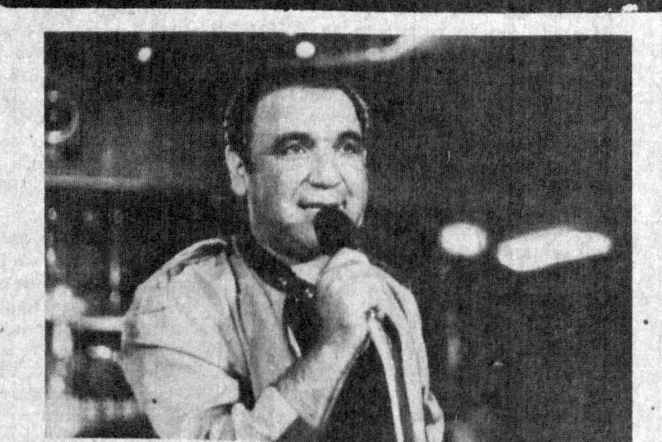
— Азия телемуштарийлар! СОАТ миллари вақти-соати-миз, йўғ-ей, кўрсатуви-миз вақт-соати ичкисига етгани-ни кўрсатяпти. Шундай қи-либ «КЎВНОҚЛАР ВА ҚО-ЧОҚЛАР», кеңирасиз, «КЎВ-НОҚЛАР ВА ҲАНДАЛАК-ПУРУШЛАР» ҳақидаги қис-қа метражлик кўрсатуви-нини дастлабки қисми қисқа-мига.