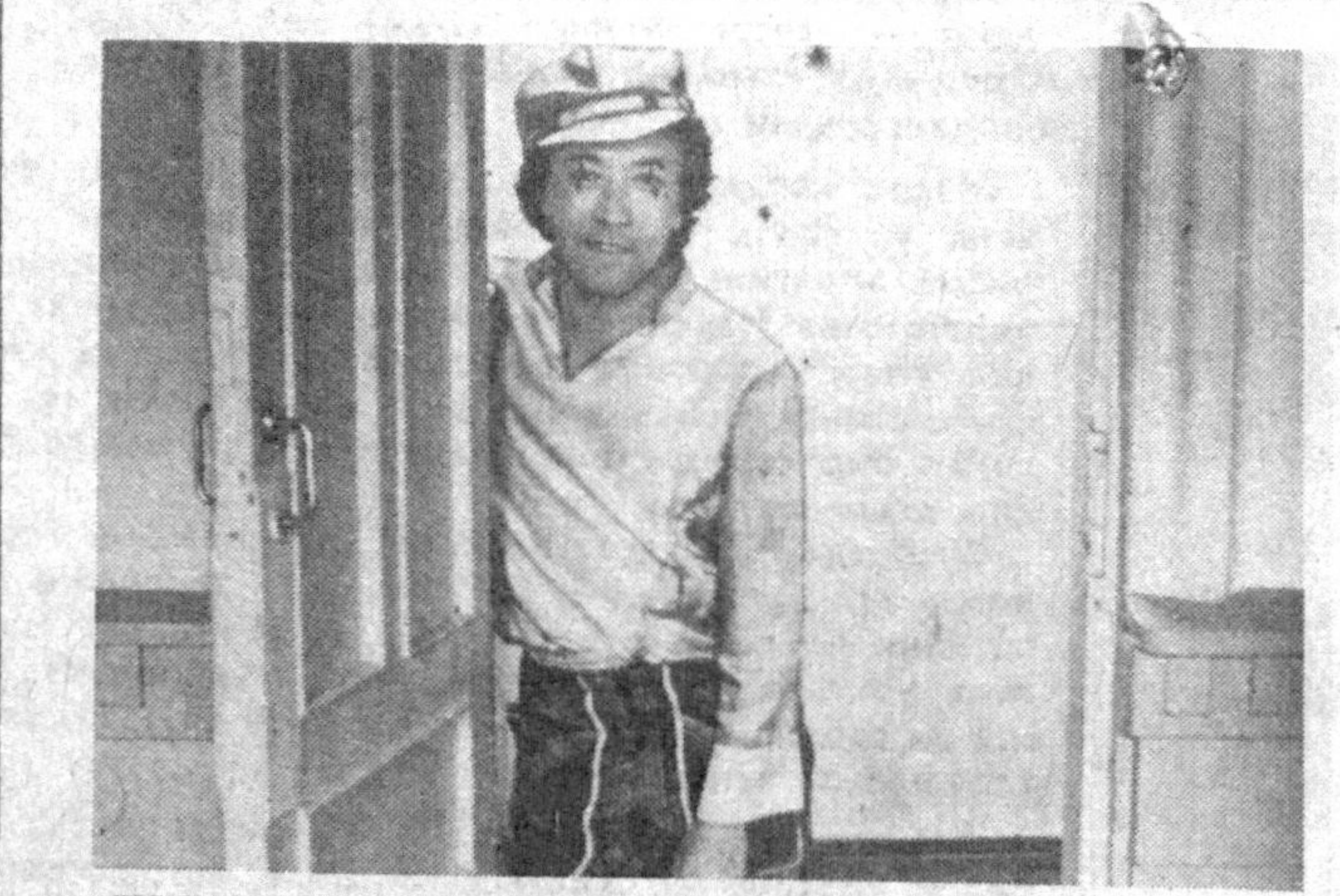
...ШУМлик қиёматин. Онанг сезмай қўяқолиб. Йўкса уй-га киргазмайди. Яна туни би-лан масхарабога ўхшаб эшик олдида тиржайиб чи-майлик!