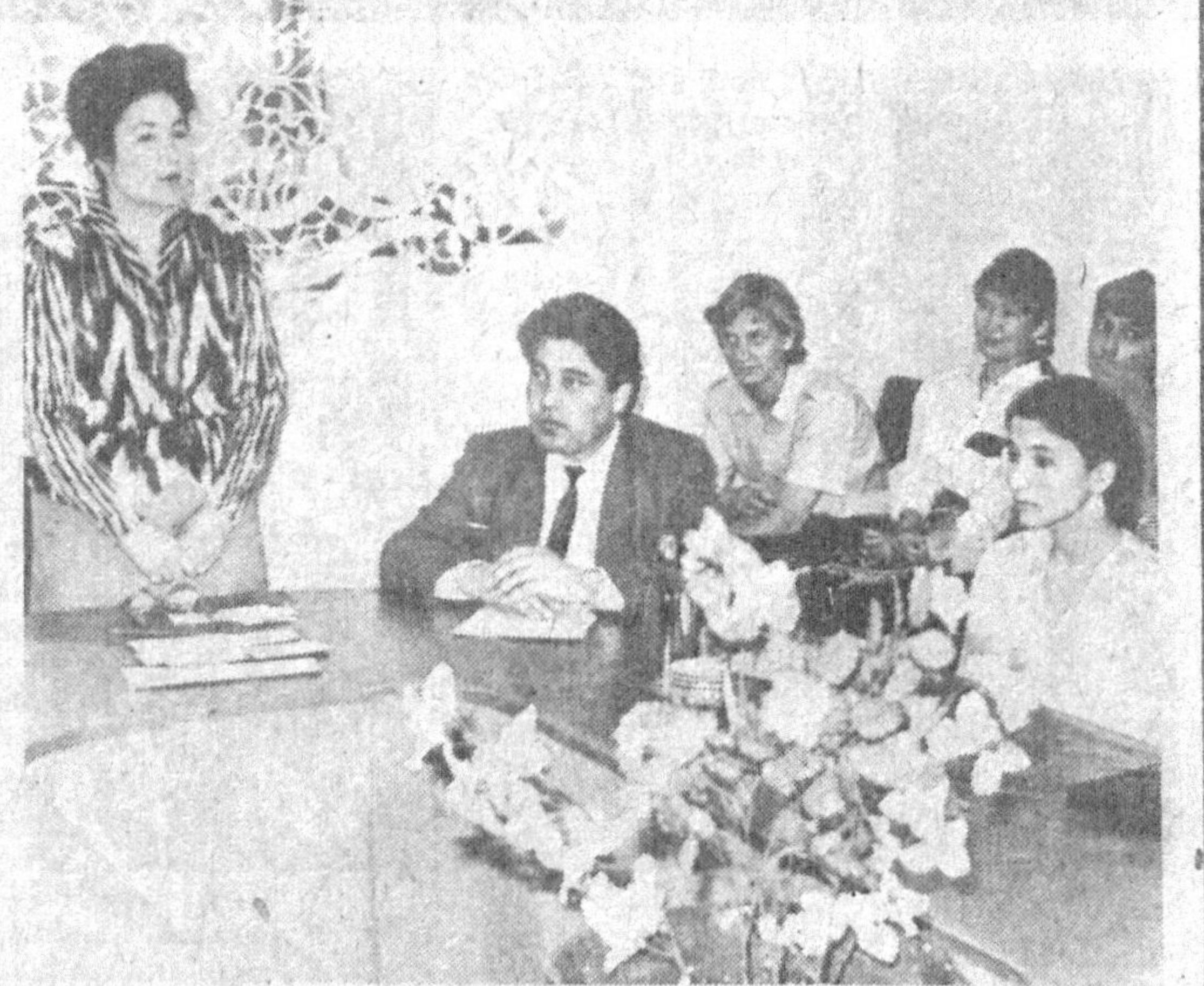
дваримизнинг Беруний, иби ўша ёруғ кунларнинг келиши Сино, Фаробий, Улубек, Мах-тумқули, Бердақларни етмиш чикади. Яна жаҳон ақли Мар-казий Осие деганда алломалар лавҳалар.

Марказий Осие давлатлари билимдонларининг Тошкент уч-рашуви натижаси ўлароқ бу анжуман келажакда илгалари билимдонларнинг дўстлик ришталарини янада мустақ-имлашшига муносиб ҳисса бўлди. Кўзлари қаққон, зиярак болалар ўзларининг зина-ларга қодир эканликларини кўрсатдилар. Катталарнинг ҳайрат ва қувончининг чегара-си бўлмади. Уларнинг барча оғир синоваларидан бешар ҳа-йиқмай, бемалол ўтишди. Жа-воб беролмай, уялиб қолган-ларни даярли учратмадик. Шу кунни катта бир ҳақиқат юзага чиқди. Кўнги Туркистон - тур-роғи низоҳатда истеъодларга бой экан. Ҳали пешонаси ар-қираган бу болалар ичкдан