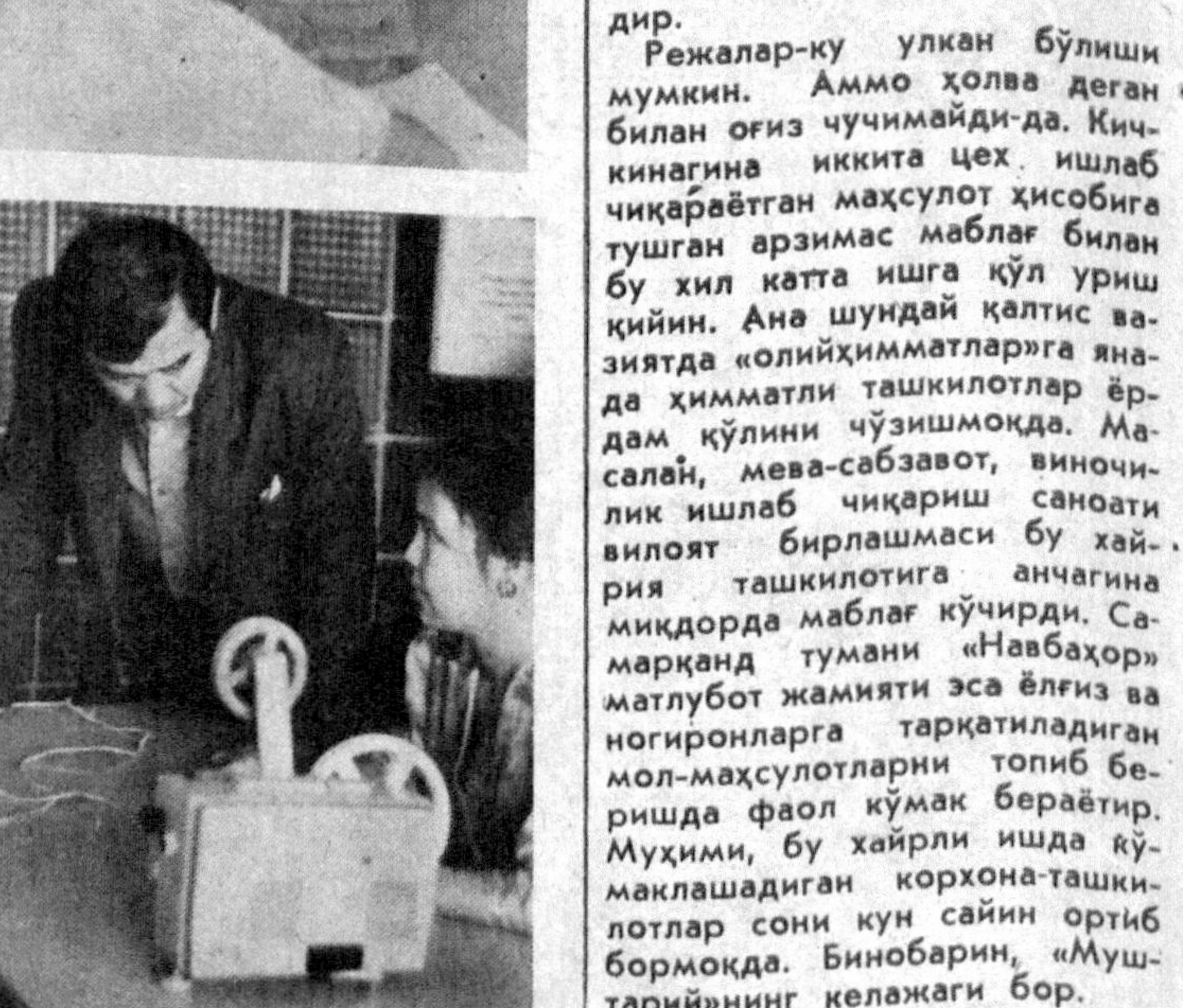
Айни кунларда республикамиздаги барча олий ўқув юрталарида ёлғиз синов ва имтиҳонлар давом этмоқда. Тошкент ирригация ва қиш...