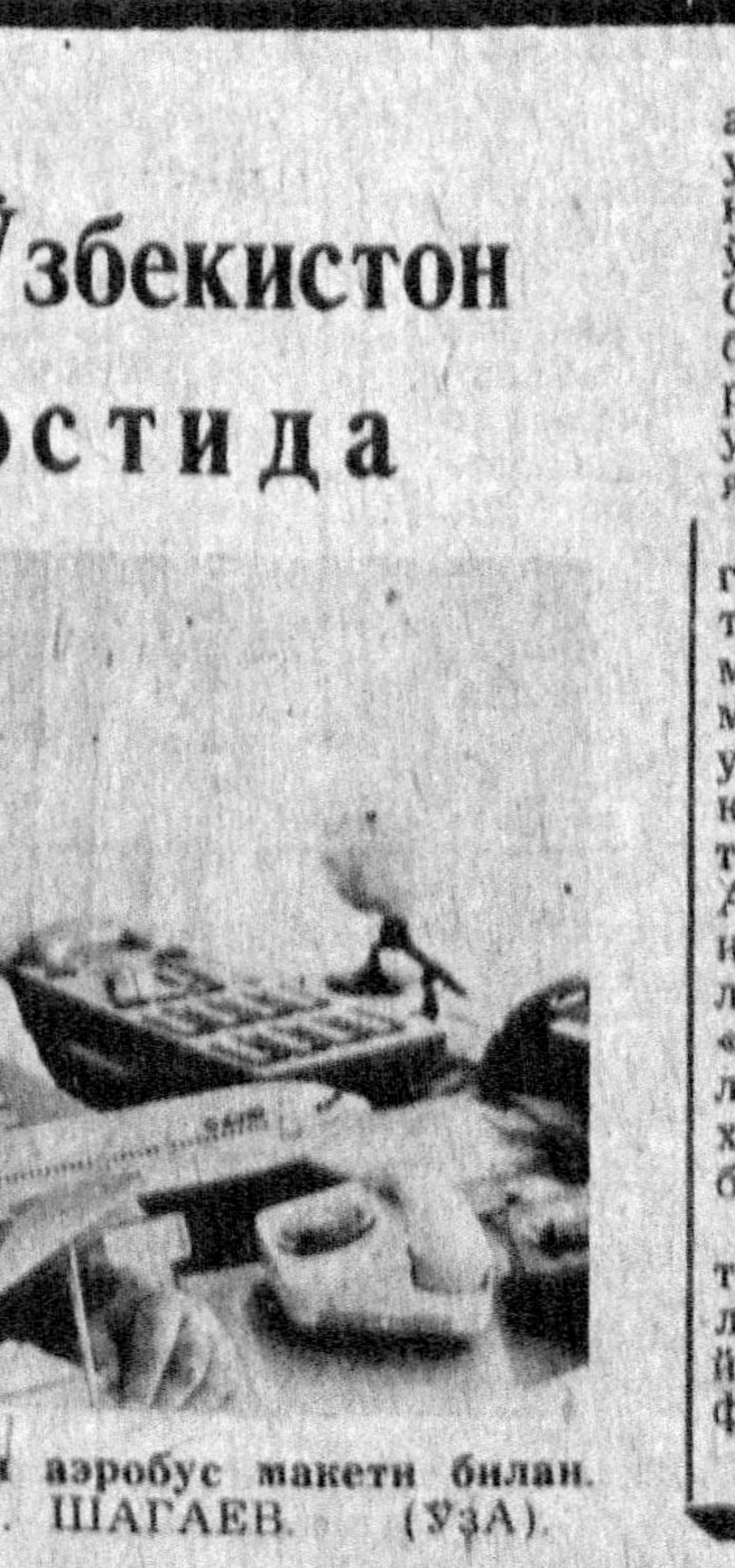
СУРАТДА: А. Рўзметов янги аэробус макети билан.

Республикада ёшларга таълим бериш масалаларига давлат сиёсати, деб қаралаётгани таъкидлаб ўтилди. Хусусан истеъдодли йигитлар ва қизларни саралаб олиш ва уларга таълим беришга қаратилган тадбирлар мажмуи ишлаб чиқилган. Тест синовини ҳам шу мақсадага қаратилган бўлиб, бу усул бир қанча олиқ ўқуруларда тажриба сифатида синовдан ўтди, мактабларда ҳам жорий этилмоқда. Бу янгиллик бўлажак мутахассислар, ўқувчилар билимига ва тайёргарлик даражасига, муаллимларнинг иши сифатида янда хослик баҳо беришга имконият яратди.