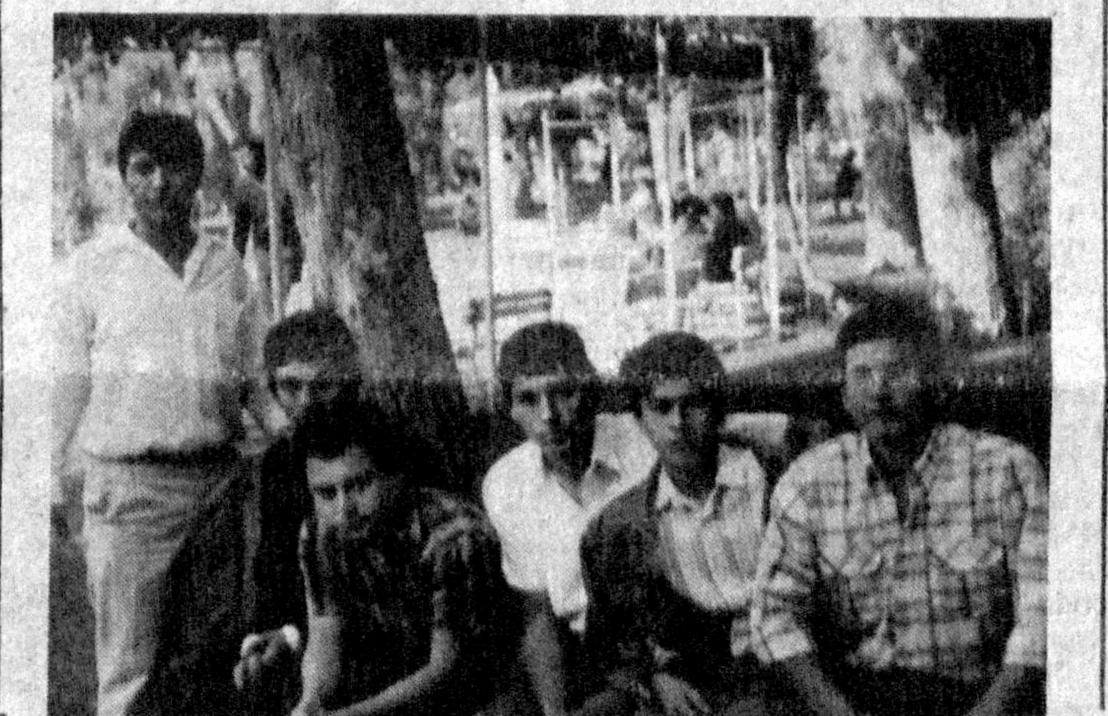
Биз ўйибатган Барнова университетини Туркия давлатидеган энг муфозил олий ўқув юрталаридан бири экан. Бунга бир йиллик ўқиш жараёнида яна бир қарра амин бўлдим.