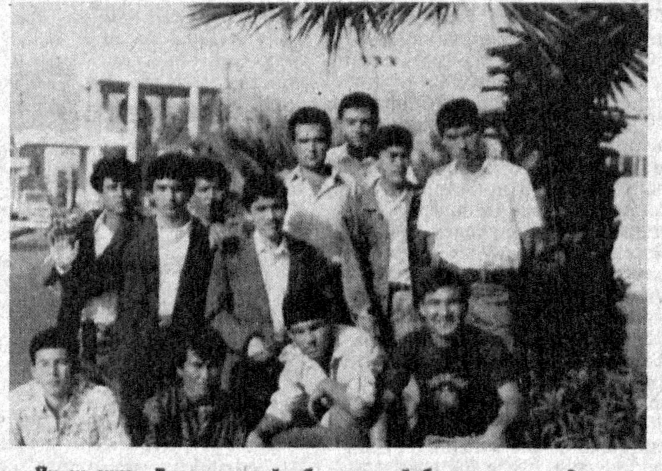
Ўқиш учун Туркияга жўнаб кетган ўзбекистонлик 2 минг талаба таълимининг биринчи йилини тамомлаб, ойна юртра қайтиб келишмоқда. Бир вақтлар Абдурауф Фитрат ҳам Истанбулда таълим олган эканлар. Ҳозир Туркиядан қайтаётган йигит-қизларимизни Туркистон дегун қўнган Абдурауф доманинг издошлари деб аташга ҳақлими.

Биз ўйибатган Барнова университетини Туркия давлатидеган энг муфозил олий ўқув юрталаридан бири экан. Бунга бир йиллик ўқиш жараёнида яна бир қарра амин бўлдим.