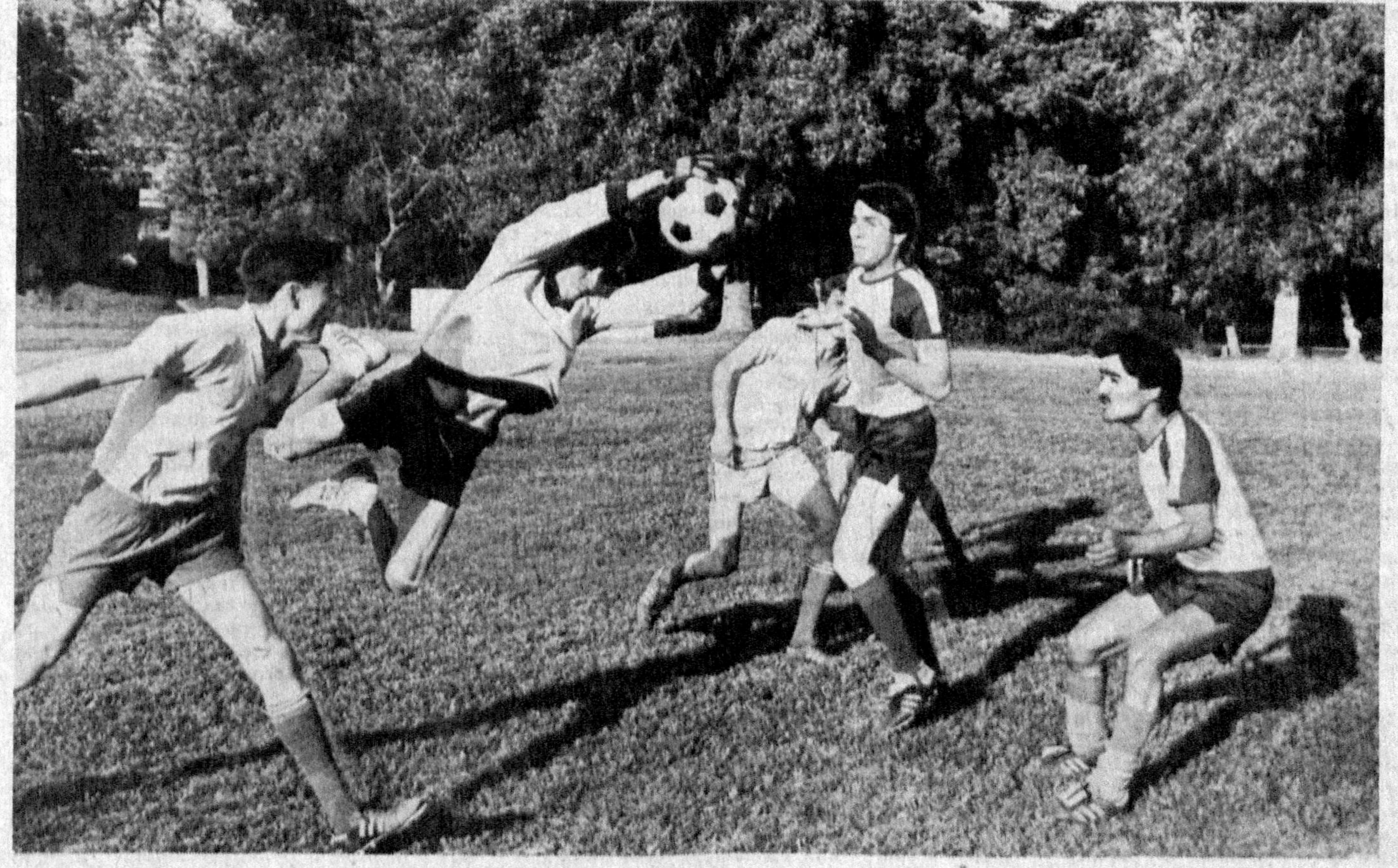
Суратдаги «ўзбекининг Марadona»лари «Янгийўлмебель» давлат акциядорлик бирлашмаси ишчилари. Бу ерда бошқа корхоналардан фарқли ўлароқ яхши дам олиш, спорт турлари билан шуғулланиш кенг йўлга қўйилган. Бир-

лашма ишчилари яратилган бундай шароитдан мамнун бўлмоқдалар. Ҳар бир цехнинг футбол командаси бўлиб, уларнинг ўйинлари шундай шиддатли тусда ўтади.