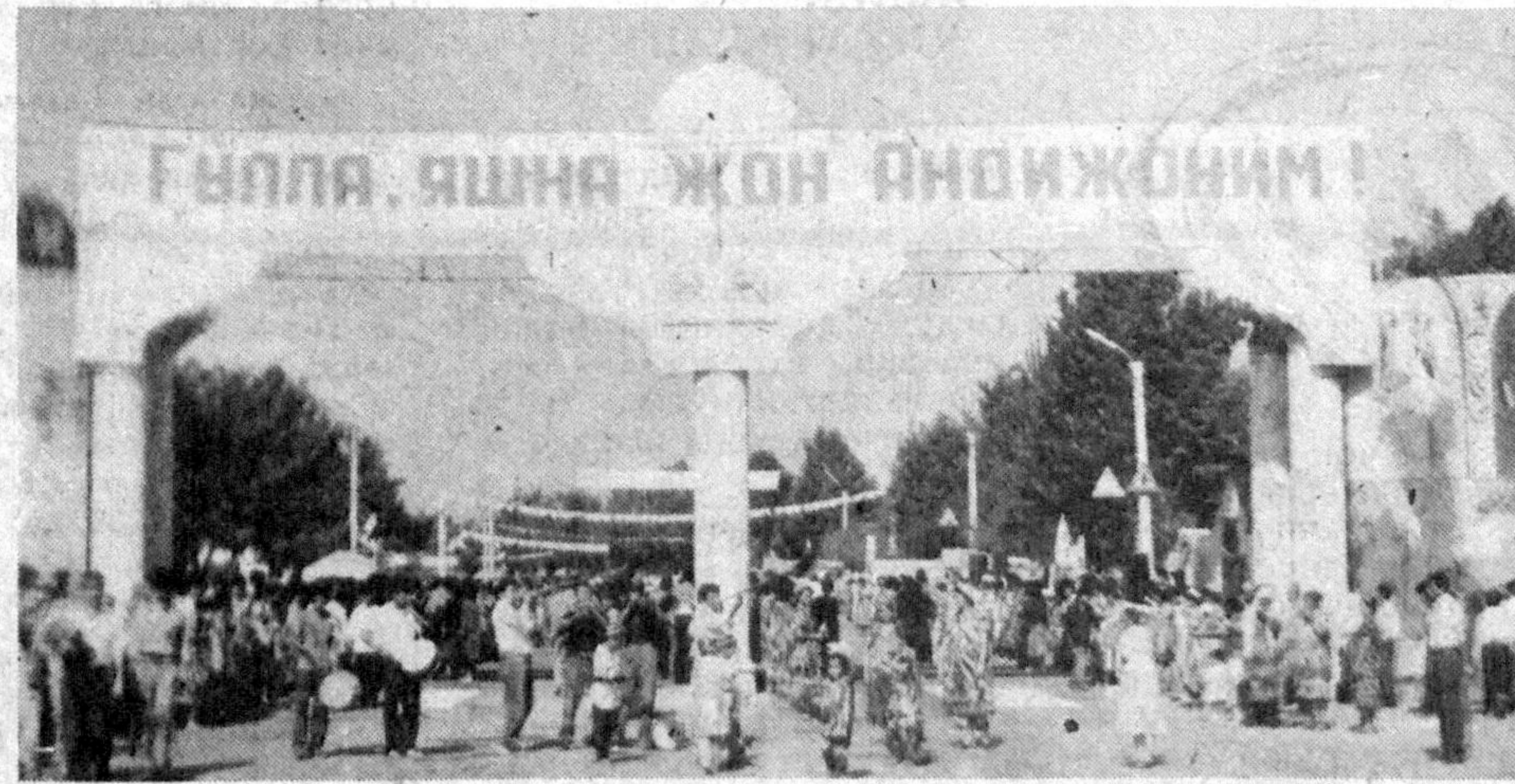
«Гулла, яшна, жон Андижоним»