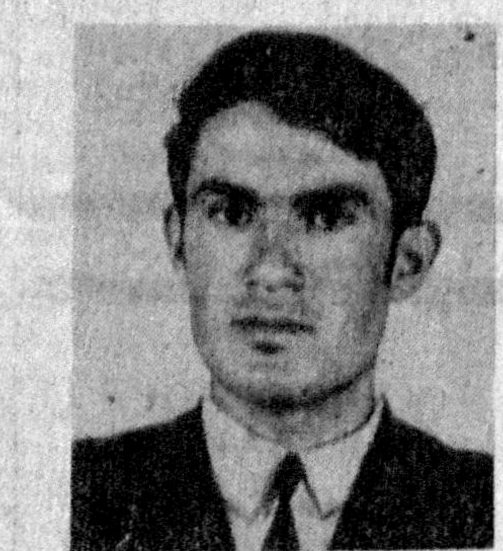
Қоракўлга кўнича фаслар сингари ўзгарувчан кай...

фийятда бораман. Марҳум Рашиданнинг онаси ишлаган бекиригимизга «Шайхлар» қишлоғига етмасиданоқ ушбу муштариф аёл бус-бутунидиғча ҳаёлимда гавдаланади.