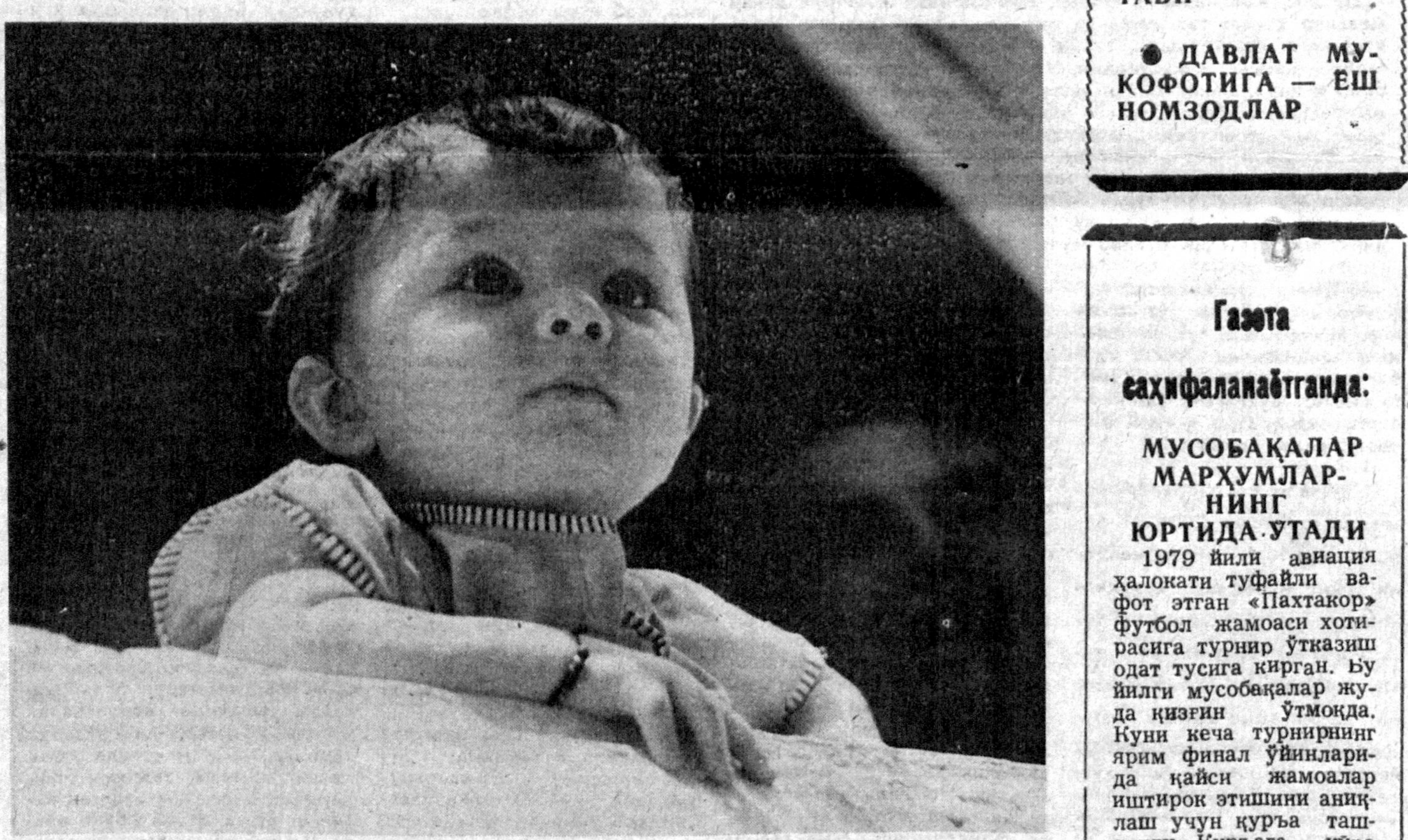
ҲАЙРАТЛАРИНГ БЕҒБУБОР, СОДДА