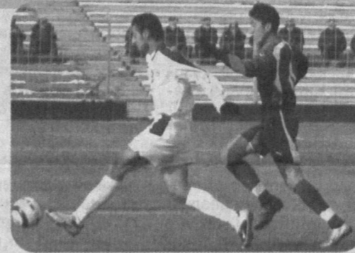
с занимающим сейчас второе место в группе А «Насафом» (Карши).

В группе С молодые футболисты «Бунедкора» (Ташкент) в последнем туре против «Динамо-01» (Карши) победили со счетом 3:2 и вышли в полуфинал. Теперь «Бунедкор» сыграет