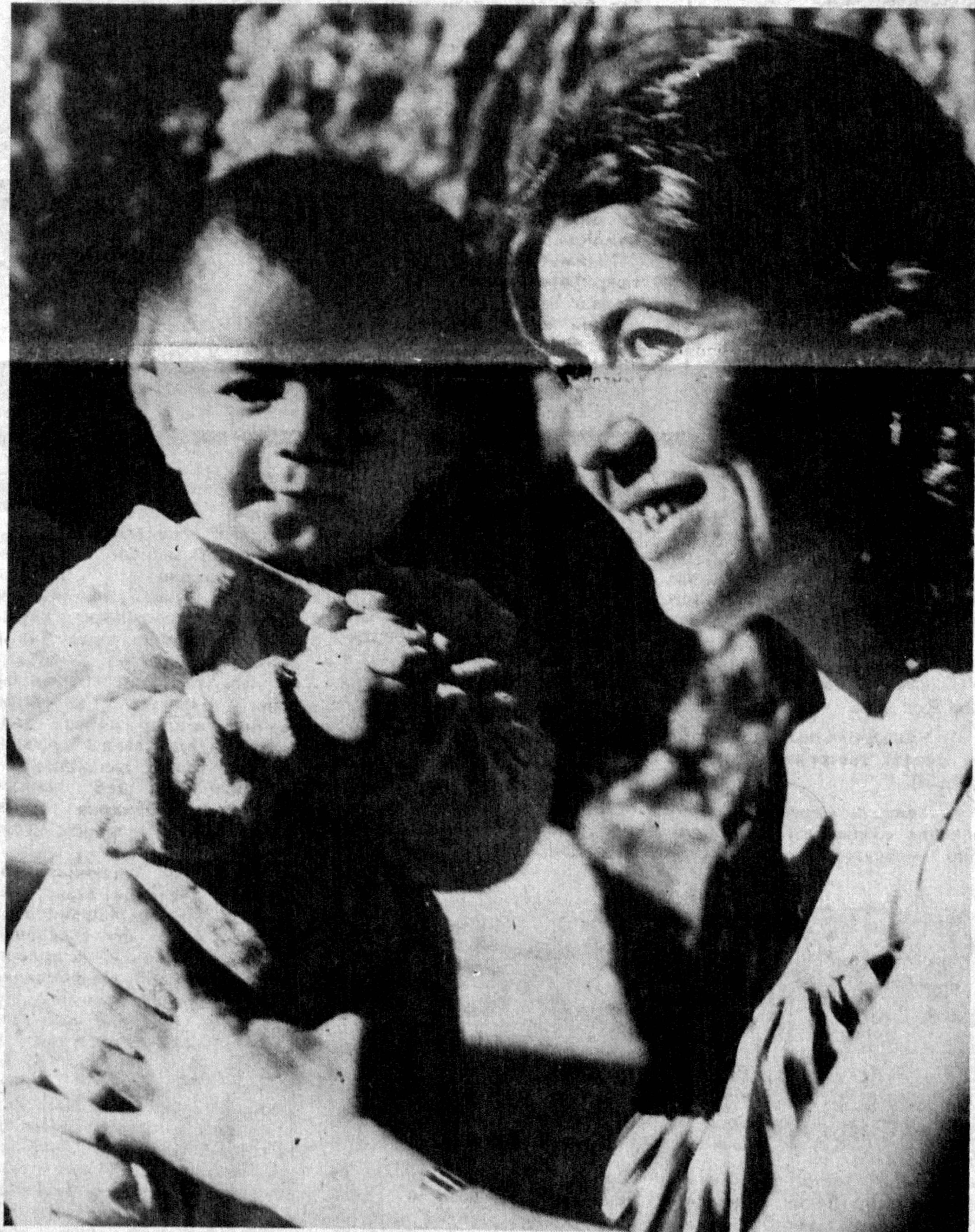
СЕВИНАМАН ТИНИҚ ЮЗИНГДА КҮРИБ ТУРСАМ УЗИМНИНГ АКСИМ...