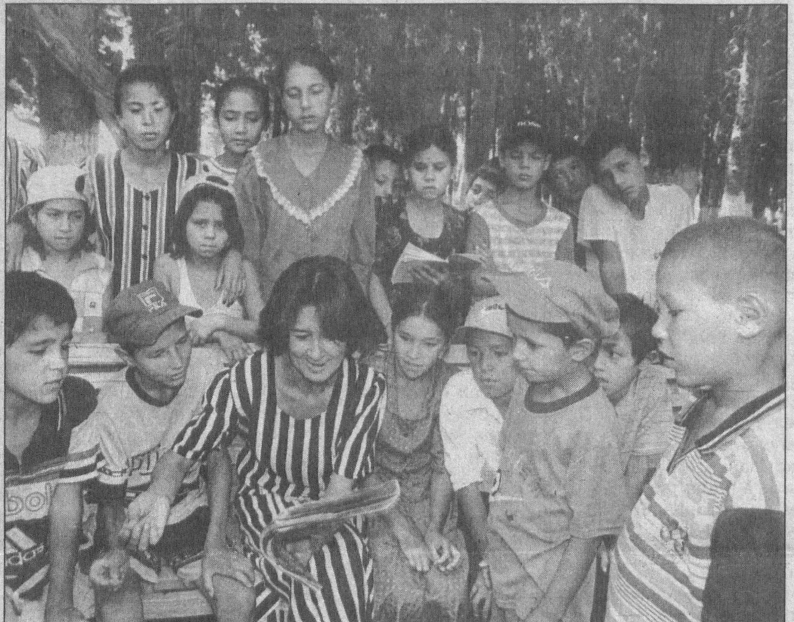
Термиз туманининг энг сўлим, баҳаво гўшасида жойлашган «Пахтаой» болалар оромгоҳи биринчи гуруҳда 204 нафар ўғил ва қизни ўз бағрига олди. Такрорланмас табиати, барча қулайликлари билан болаларга манзур бўлган оромгоҳда улар мириқиб дам олиб, саломатликларини мустаҳкамладилар. Суратда: «Пахтаой» болалар оромгоҳи дам олувчилари.