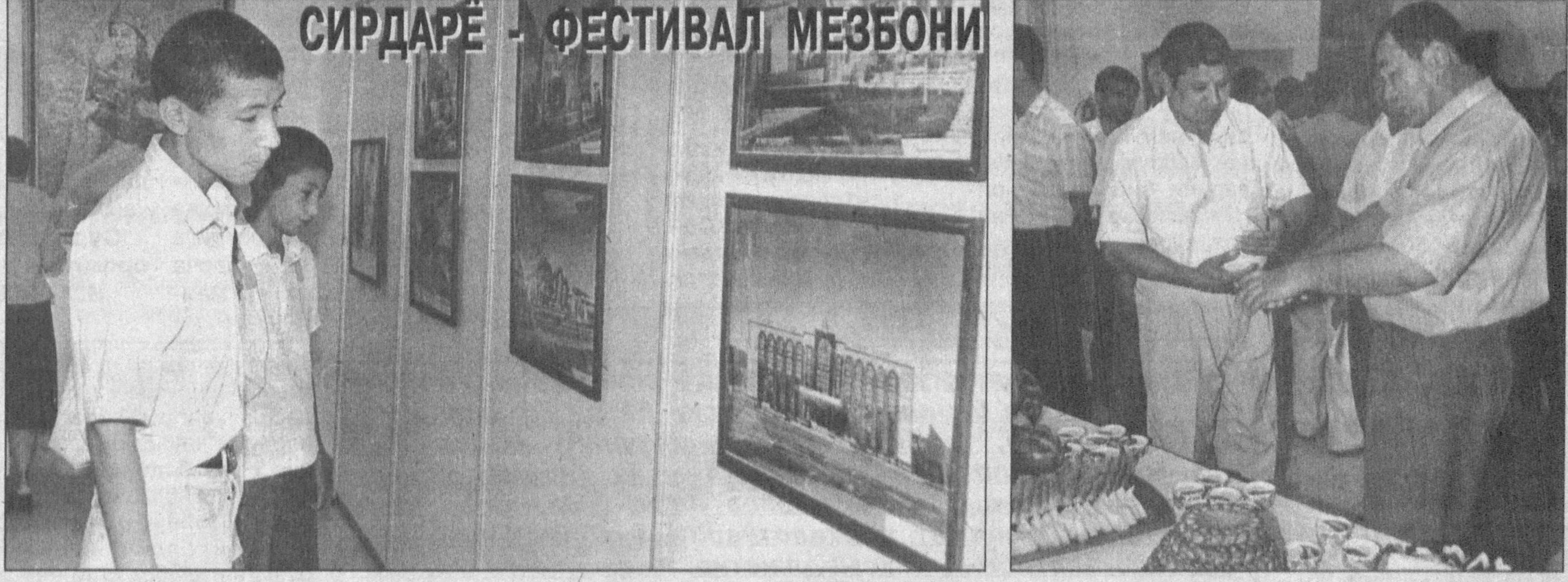
СИРДАРЁ - ФЕСТИВАЛ МЕЗБОНИ

Қадим Сирдарё бўйидаги қароқ дашту биёбонларни боғу-бўстонга айлантирган сирдарёликлар Ўзбекистон мустақиллигининг 10 йиллигига бағишланган «Шу азиз Ватан - барчамизники» республика фестивалининг навабатдаги мезбони бўлди. Бадиий академиянинг Марказий кўрғазмалар залида ўтказилган фестивал Ўзбекистон Миллий ахборот агентлиги, Республика Маънавият ва маърифат Кенгаши ва Бадиий академия томонидан Сирдарё вилояти ҳокимлиги билан ҳамкорликда ўтказилмоқда. Фестивал очилишида қатор вазирлик, идора, корпорация, бирлашма, жамоат ташкилотлари вакиллари иштирок этди.