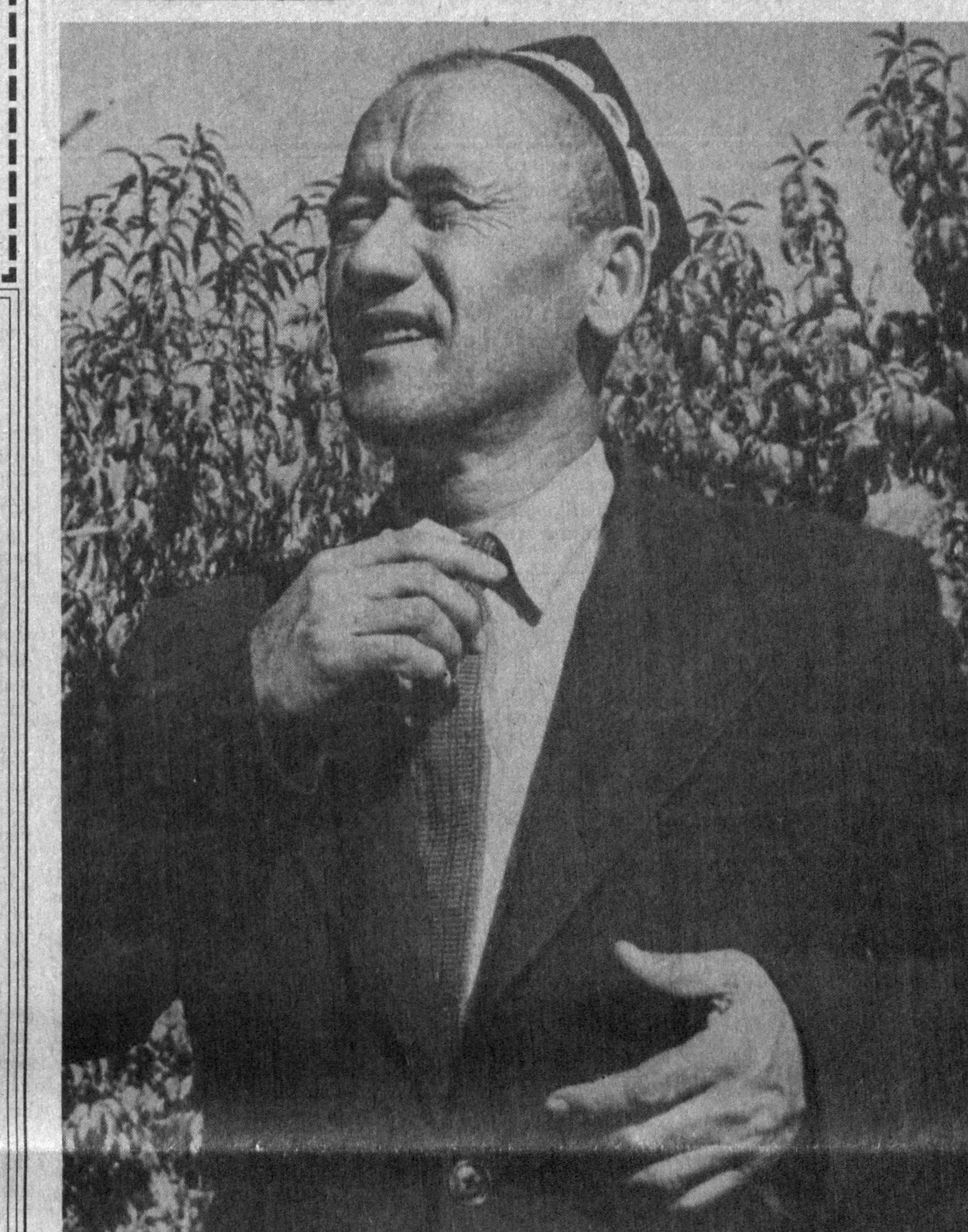
Ўзбекистон халқ артисти Карим Зокиров. 1960 йиллар.