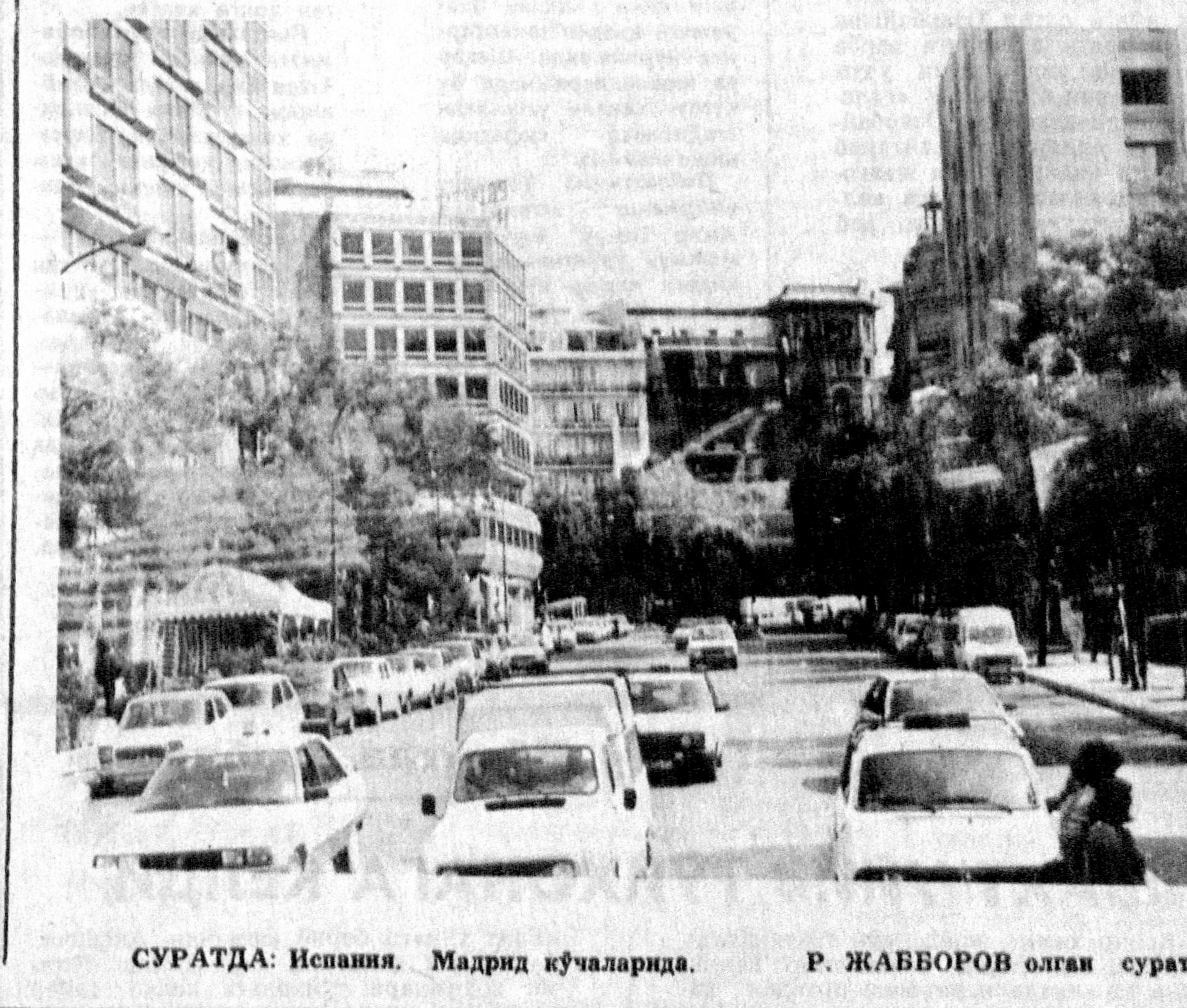
СУРАТДА: Испания. Мадрид қўчаларида.

ВАШИНГТОНГА расмий таширф буюрган Украина мудофаа вазир К. Морозов ҳарбий мақмада раҳбари Ў. Эспин томонидан қабул қилинди ва унинг биричи ўринбосари У. Перри билан музокара ўтказди. Пентагон вақтининг маълум қилишча, Украинадаги ядро қуро-ларини тугатиш муаммолари мухомада қилинган. Украина вазир АҚШ давлат котибининг янги муста-қил давлатлар бўйича маънос маслаҳатчиси С. Тэлбот билан ҳам учрашди. Бу учрашувда ядро қуролини тар-қатмаслик тўғрисидаги битим. Украинадаги портлючи ядровий қаллақларнинг тақдирини каби масалалар мухома-да қилинди.