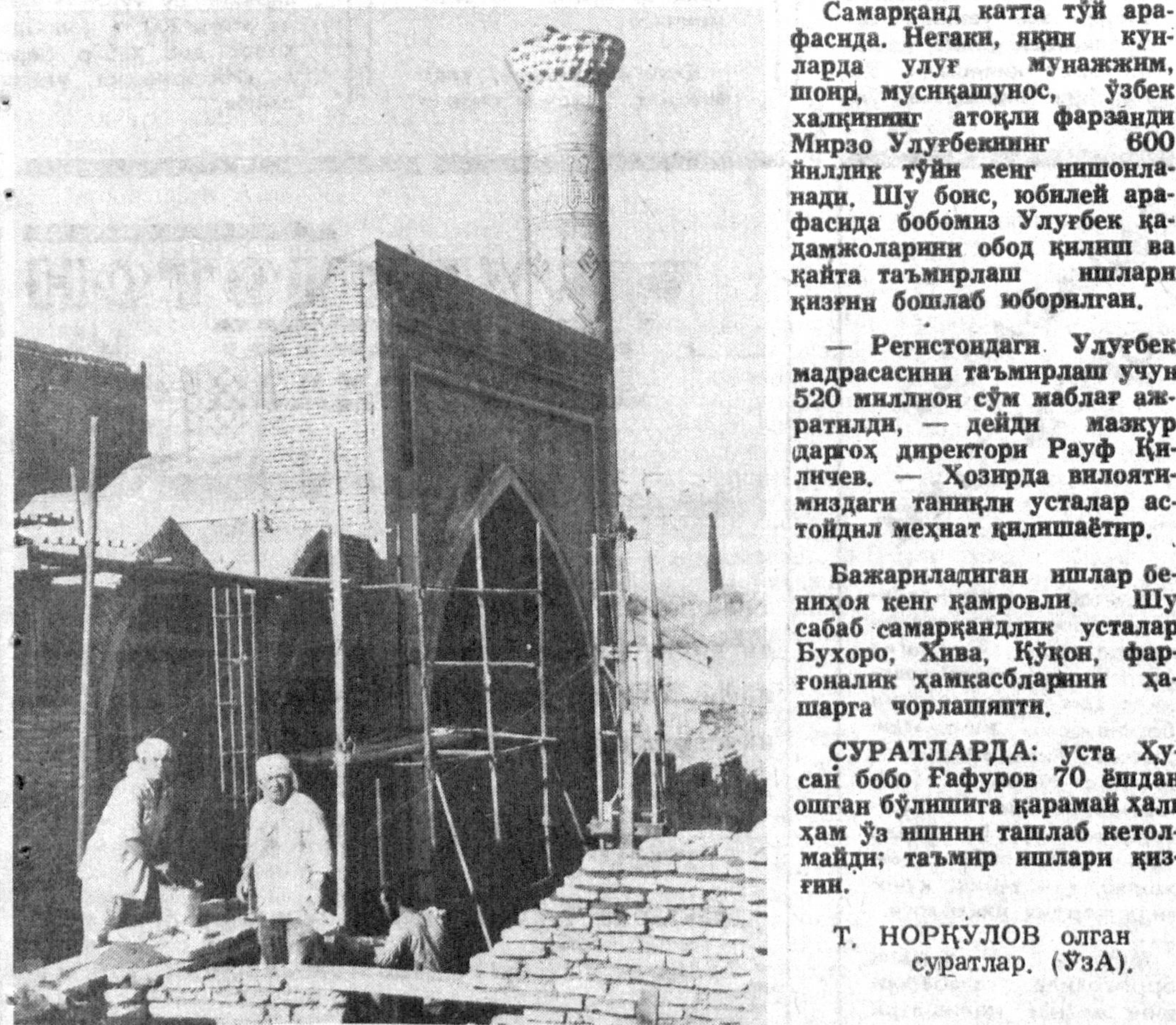
Самарқанд катта тўй арафасида. Негаки, яқин кунларда улуг мунажжим, шоир, мусиқашунос, ўзбек халқининг атоқли фарзанди Мирзо Улуғбекнинг 600 йиллик тўйи кенг нишонланади. Шу боис, юбилей арафасида бобомиз Улуғбек қадимжоларини обод қилиш ва қайта таъмирлаш ишлари қизғин бошлаб юборилган.

— Регистондаги Улуғбек мадрасини таъмирлаш учун 520 миллион сўм мабдағ ажратилди, — дейди мажор директор Рауф Қилчов. — Ҳозирда вилоят миқёсидаги таъмир ишлари астойдил жарағат қилинмоқда.