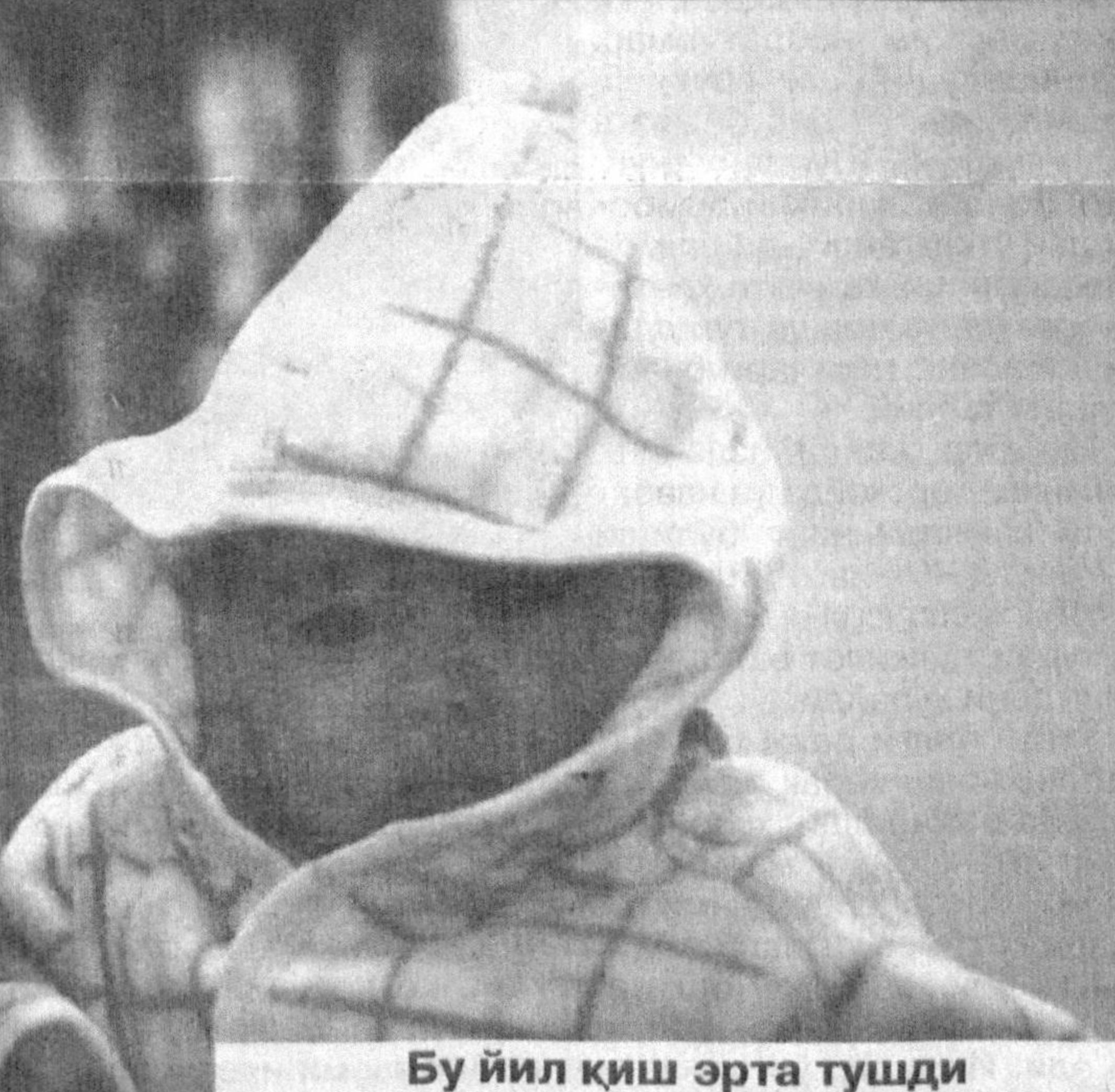
Бу йил қиш эрта тушди