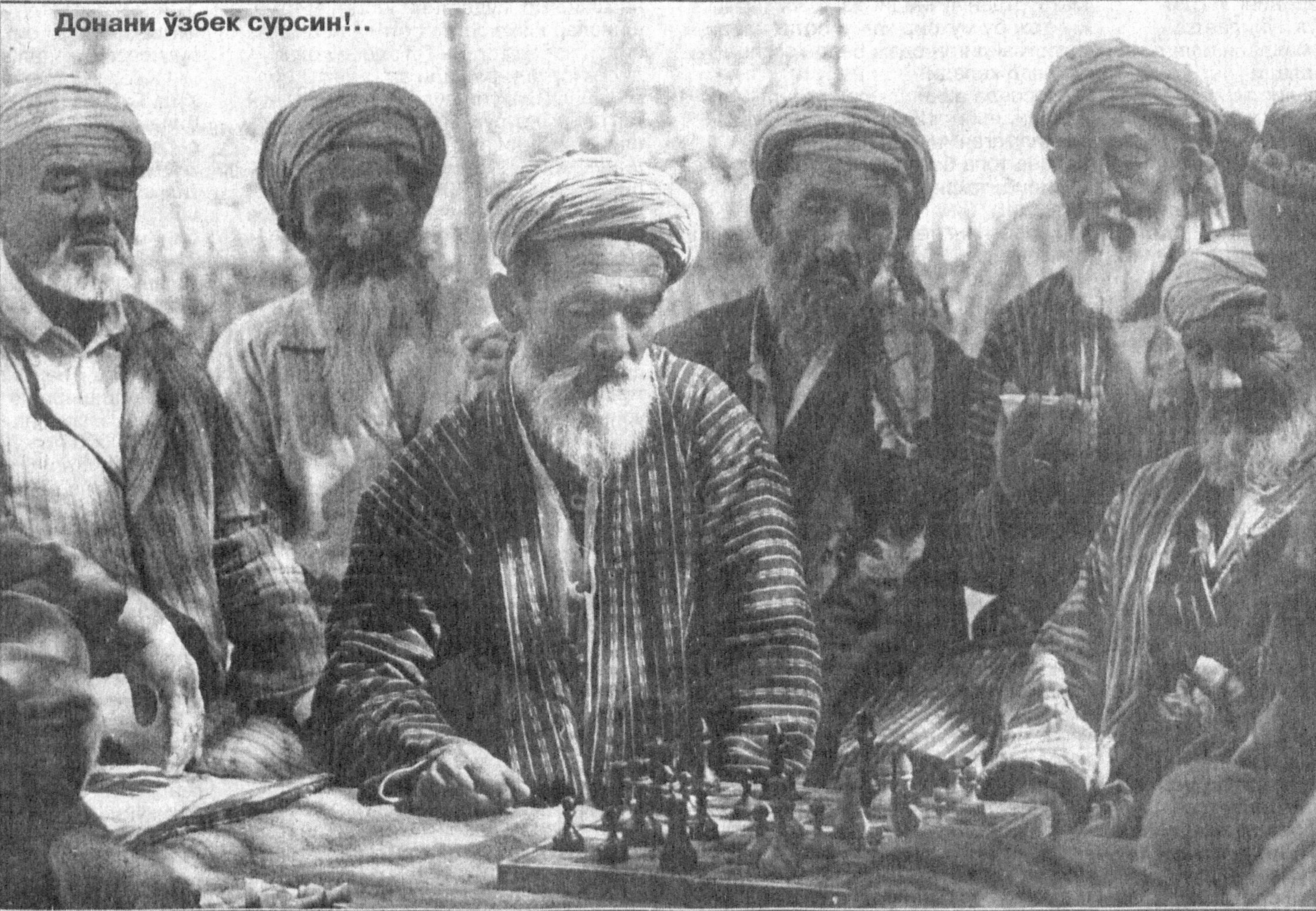
Донани ўзбек сурсин!..

ларнинг аксарияти ёшлар, фарзандларимиз - бизнинг келажакимиз. Болалар катталарга тақдир қилдилар. Улар спортчи ака-опалари эғниларидидаги чиройли, сифатли спорт кийимларига суқланиб қарашади. Ва, албатта, ўларидан ҳам ана шундай кийимларнинг бўлишини хошлашади. Улар ҳали ўз мамлакатлари кийимларини кийишни, ундан фарқлиниш нима эканлигини англамайдилар. Чунки бизда сифати бежиримлиги билан ўзига тортидиган спорт кийимлари ишлаб чиқарилмади. Борлари ҳам денгиздан томи. Фараз қилинг, зафар қуч-