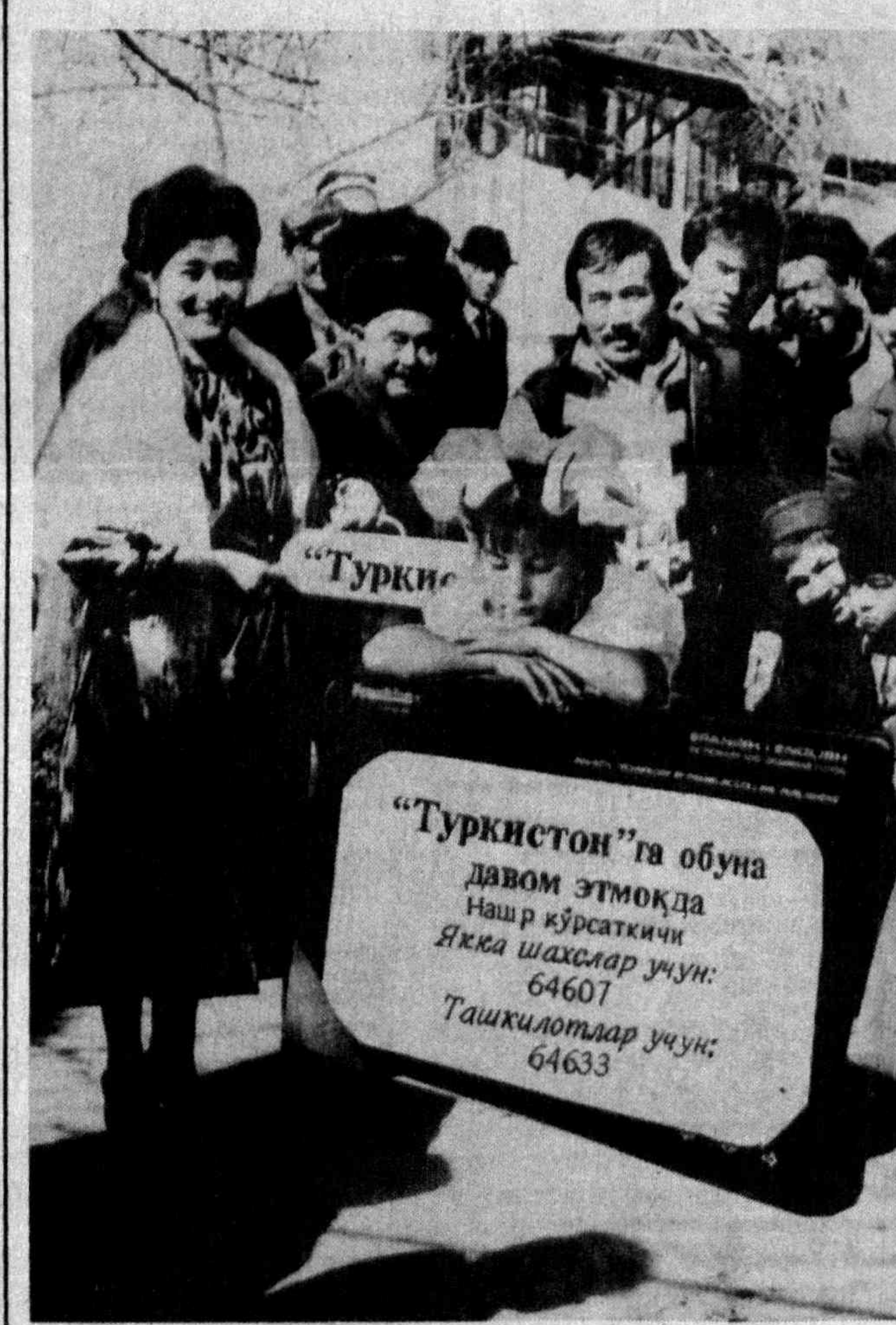
«Туркистон»га обуна давом этмоқда. Нашр кўрсаткичи Яққа шахслар учун: 64607. Ташкилотлар учун: 64633.

Бизнинг манзил: Тошкент шаҳри, Навоий кўчаси, 11-уй Ўзбекистон Республикаси ёшларининг «Камолот» жамғармаси бошқаруви. Тел: 41-28-07, 41-00-50