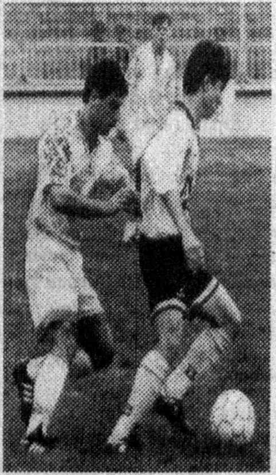
Бас, статистика етди... Негаки, сунги вақтда барчамиз чиройли ўйин томоша қилиш ўрнига, статистика билан овора бўламиз...