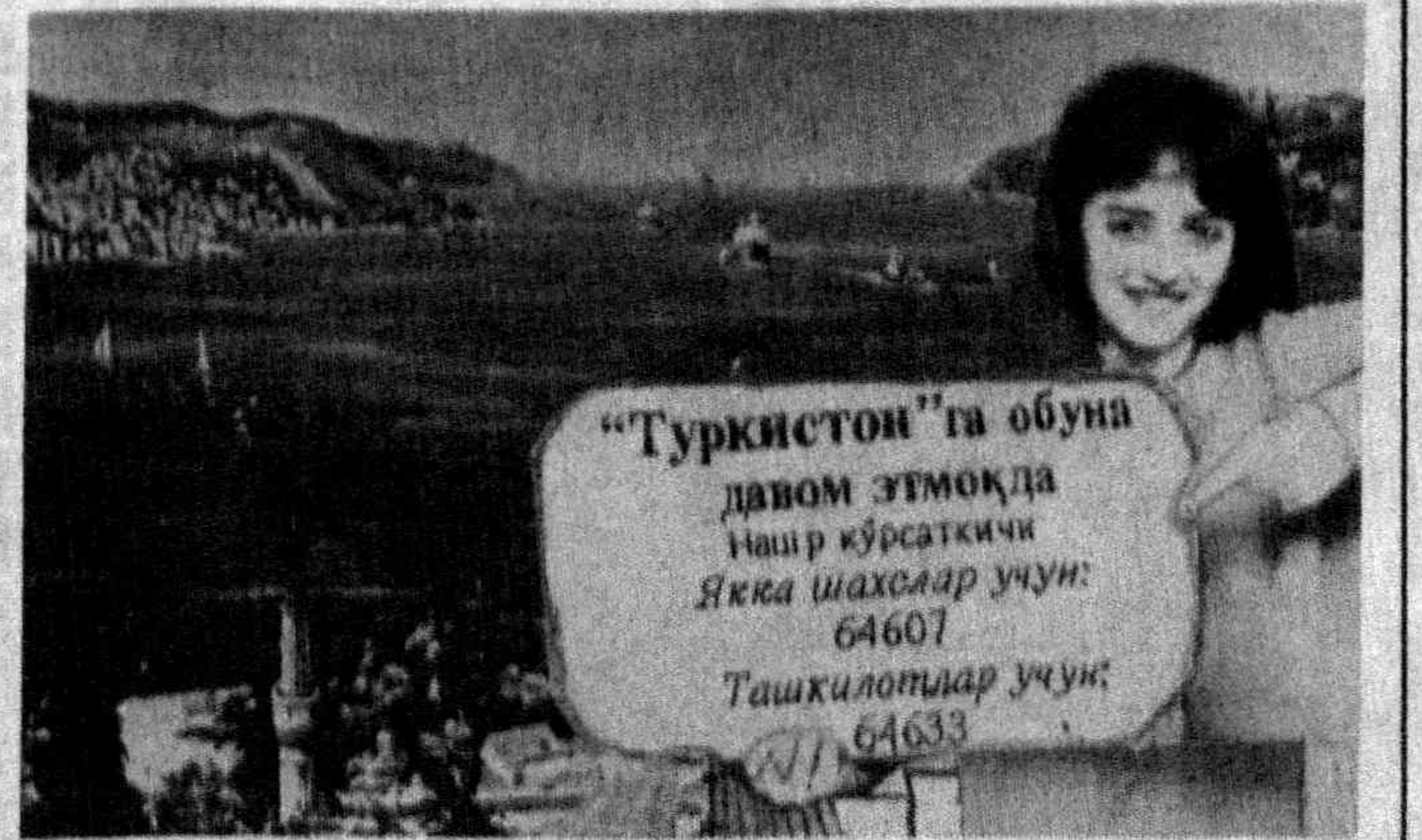
«Туркистон» та обуна давом этмоқда. Ишчи қўрақасини Яқка шахслар учун: 64601. Ташкилотлар учун: 64633.

Ўзбекистон Республикаси Валюта биржасида 1996 йил 12 ноябрда бўлиб ўтган савлода Ўзбекистон Республикасининг хорижий валютада операцияларини амалга ошириш ҳуқуқига эга бўлган банклар иштирок этиди. Сотув ҳажми 26,79 миллион АҚШ долларини ташкил этиди. Бир АҚШ долларининг қиймати 48,10 сум даражасида қайд этилди. Валюта банклар эркин муомалалари нақд валютани айир-бирлаш шавобчалари орқали сотишда уларнинг сотиш ва харид қилиш қийматини таллаб ва таққиддан келиб чиққан ҳолда мустақил равишда белгилайди. Валютани аҳолидан сотиб олишда воситачилик ҳақи олинмайди.