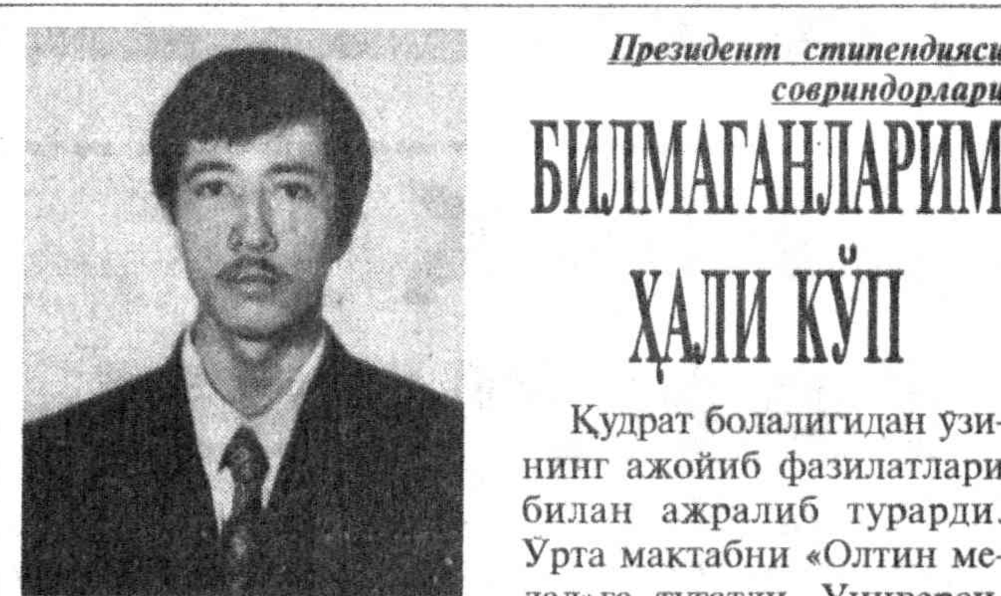
Президент сипоидисси совриндорлари