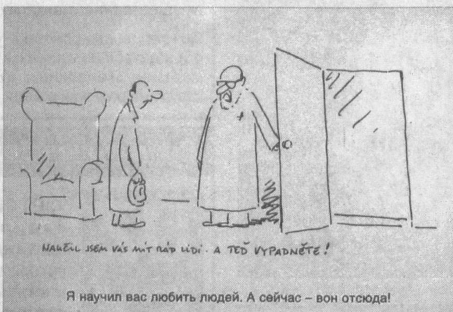
Я научил вас любить людей. А сейчас - вон отсюда!