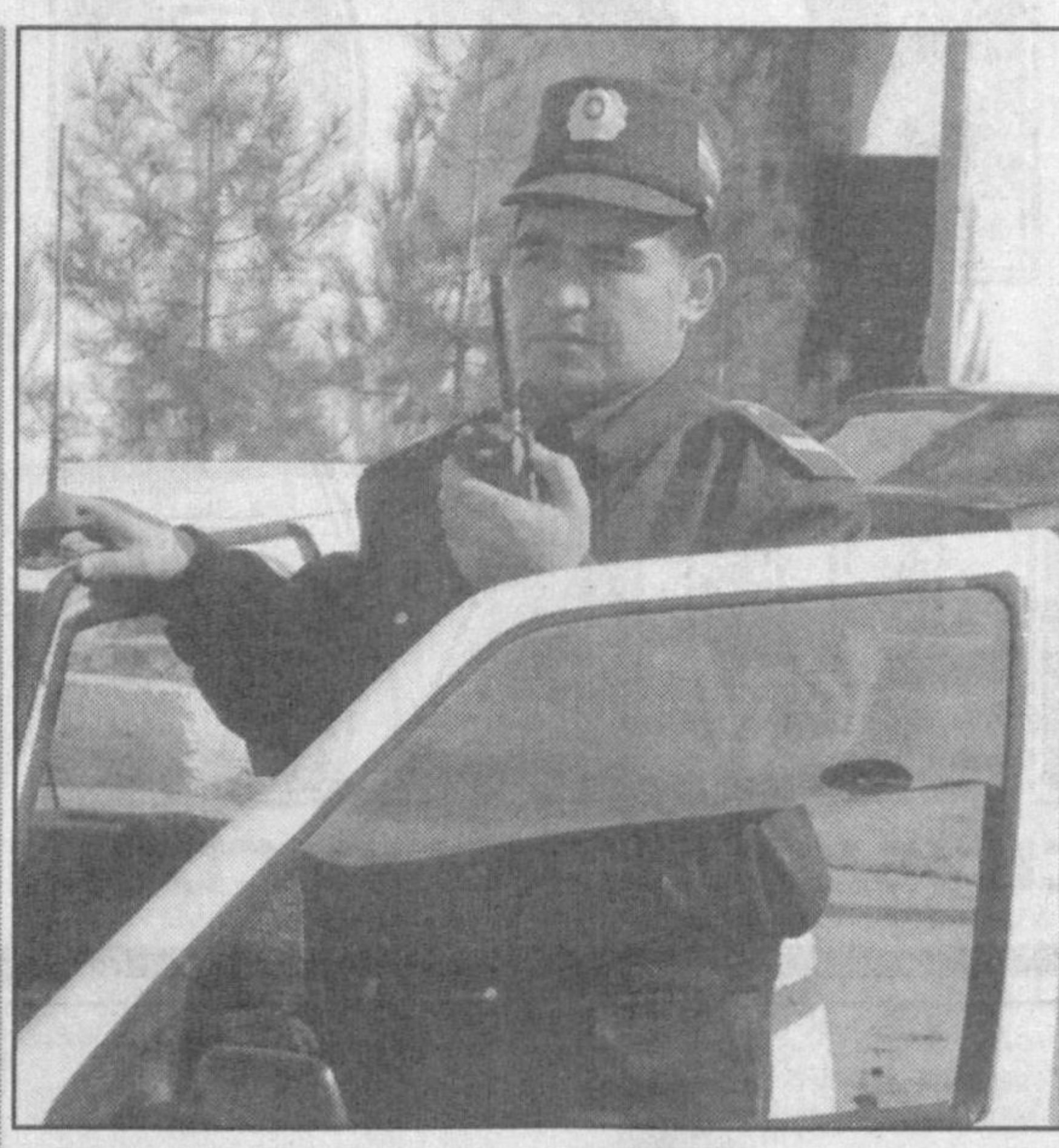
В ходе месячника предупреждения наркомании среди молодежи сотрудники органов внутренних дел Ферганской области побывали в высших образовательных учреждениях, колледжах и лицеях, общеобразовательных школах, выступили с докладами и провели беседы.

Ислама Каримова в октябре 2006 года Узбекистан с официальным визитом посетил Президент Кыргызской Республики Курманбек Бакиев, - отметил посол Кыргызстана и Кыргызстана подписали Совместное заявление, Договор и Программу об экономическом, научно-техническом и гуманитарном сотрудничестве на 2007-2011 годы. Тем самым была создана прочная правовая основа для дальнейшего расширения взаимосвязей. В ходе своей дипломатической миссии я приложу все усилия, чтобы эти договоренности были реализованы и отношения между нашими странами получали дальнейшее развитие. (УзА).