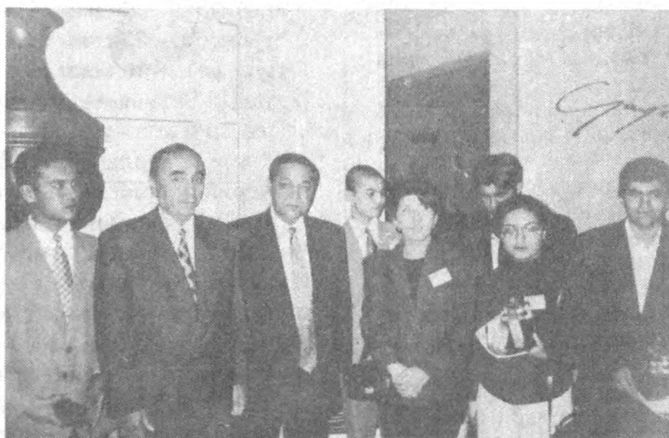
ган Ўзбекистон яқин келажақда тараққий этган мамлакатлар сафидан муносиб урин эгаллайди, деб ишонч билдиришди.

қабуллар залида ўзбекистонлик талабалар шарафига тантанали кеча ўтказилди. Кенгаш раҳбариятининг сузларига қараганда, ўзбекистонлик йигит-қизлар ўқиш жараёнида меҳнатсеварликлари, тиришқоқликлари ва билим доираларининг кенглиги билан ажралиб туради. Улар бу гапларни фахр билан айтишди. Кенгаш аъзолари ана шундай билимдон ёшларни тарбиялаёт-