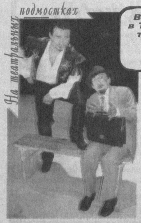
На театральном подмостках

В конце первого месяца весны в Ташкентском государственном театре музыкальной комедии (оперетты) по традиции происходит немало интересных событий.