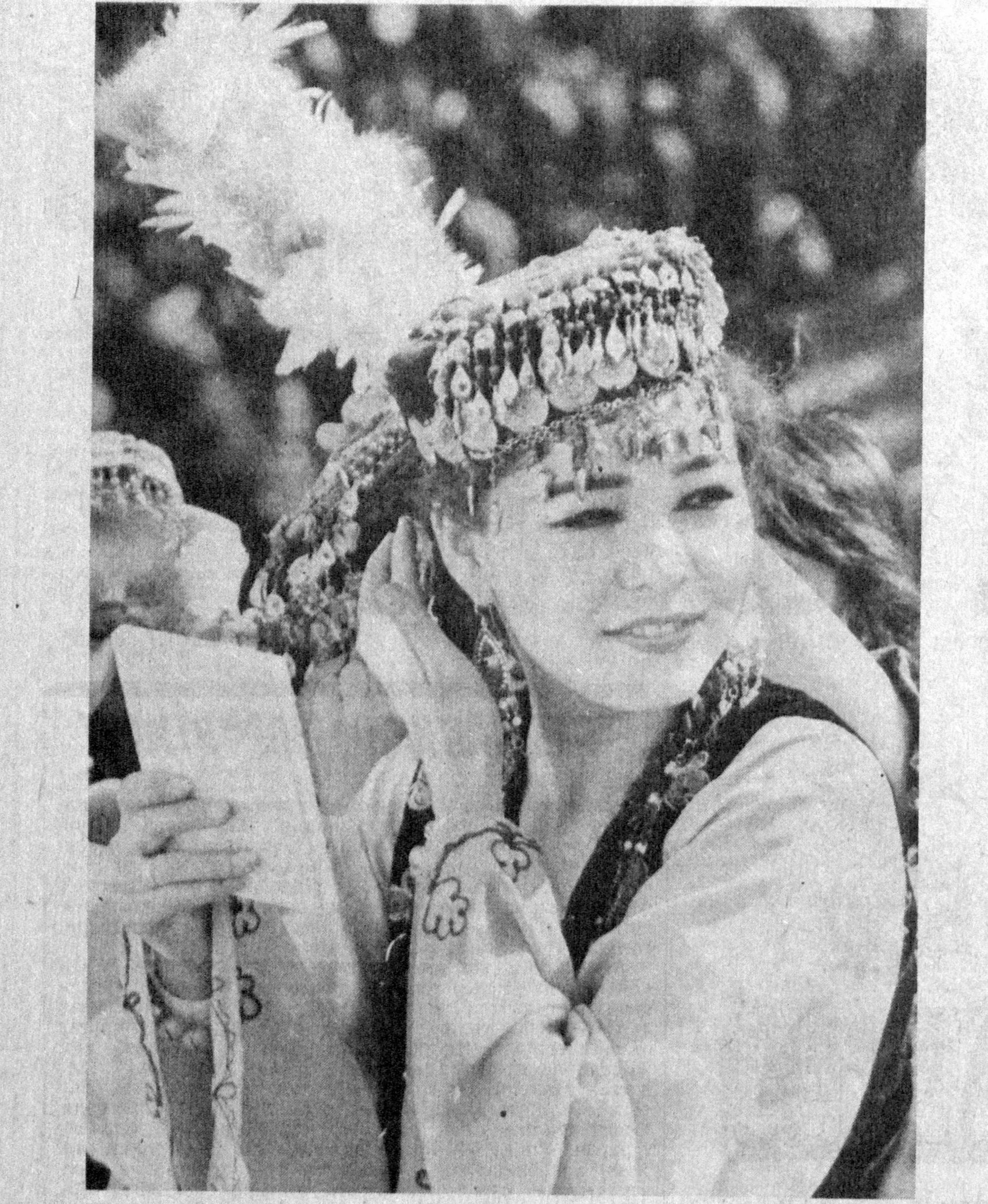
АНАВИ КИМ БУЛДИКИН-А?

Сирдарё вилояти маркази Гулистонда «Матдуба» ўзбекистон — Хитой қўшма корхонаси ҳузурида ташкил этилган янги поликлиника ишлаш бошлади. Бу ерга мурунча келадиган беморлар ноанъанавий, халқ табибати мутахассислари бўлмиш хитойлик шифокорларнинг нодир услублари ёрдамида саломатликларини мухтамлилашлари мумкин. Хитойлик шифокорларнинг бу янги Марказида саломатликларини мухтамлилашлари мумкин. Хитойлик шифокорларнинг бу янги Марказида саломатликларини мухтамлилашлари мумкин. Хитойлик шифокорларнинг бу янги Марказида саломатликларини мухтамлилашлари мумкин.