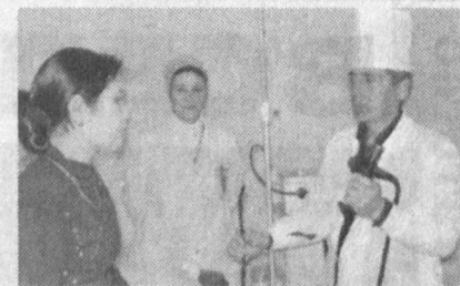
ного обследования своевременно начать лечение. Владислав НОВИЦКИЙ, наш соб. корр.

ностический центр расположен непосредственно в районном медицинском объединении, что позволяет медикам после проведения комплекс-