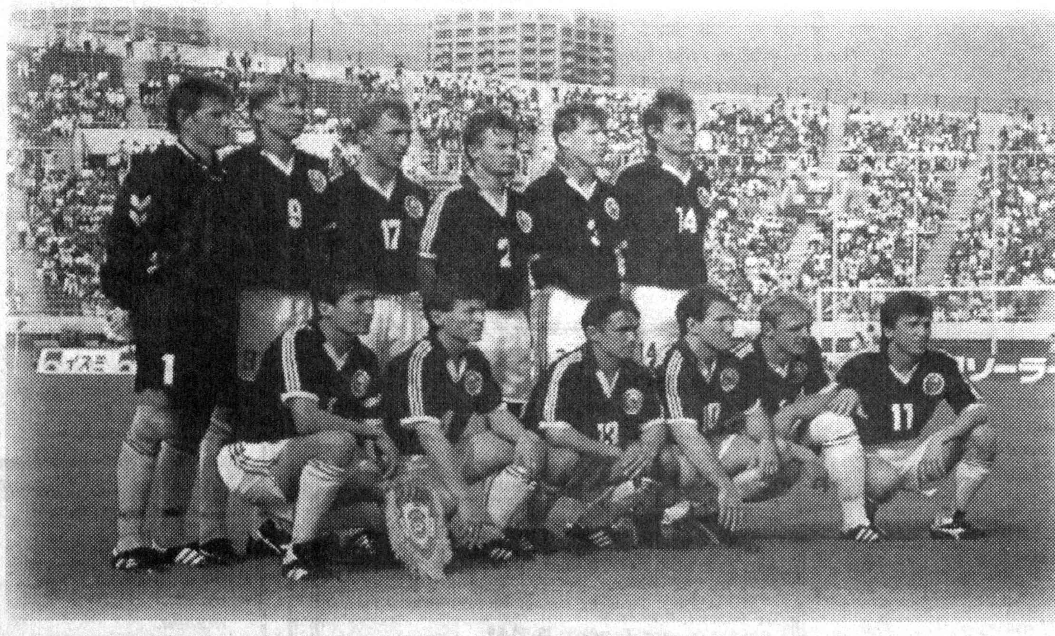
лиси 52 баробар кўп. Лекин футболда майдон ҳам, аҳоли ҳам баробар. Гап кучда!

Дастлабки учрашувимиз Хитой билан. Тугри, ҳаётда уларнинг майдонини бизникидан тахминан 21 баробар катта, аҳоли