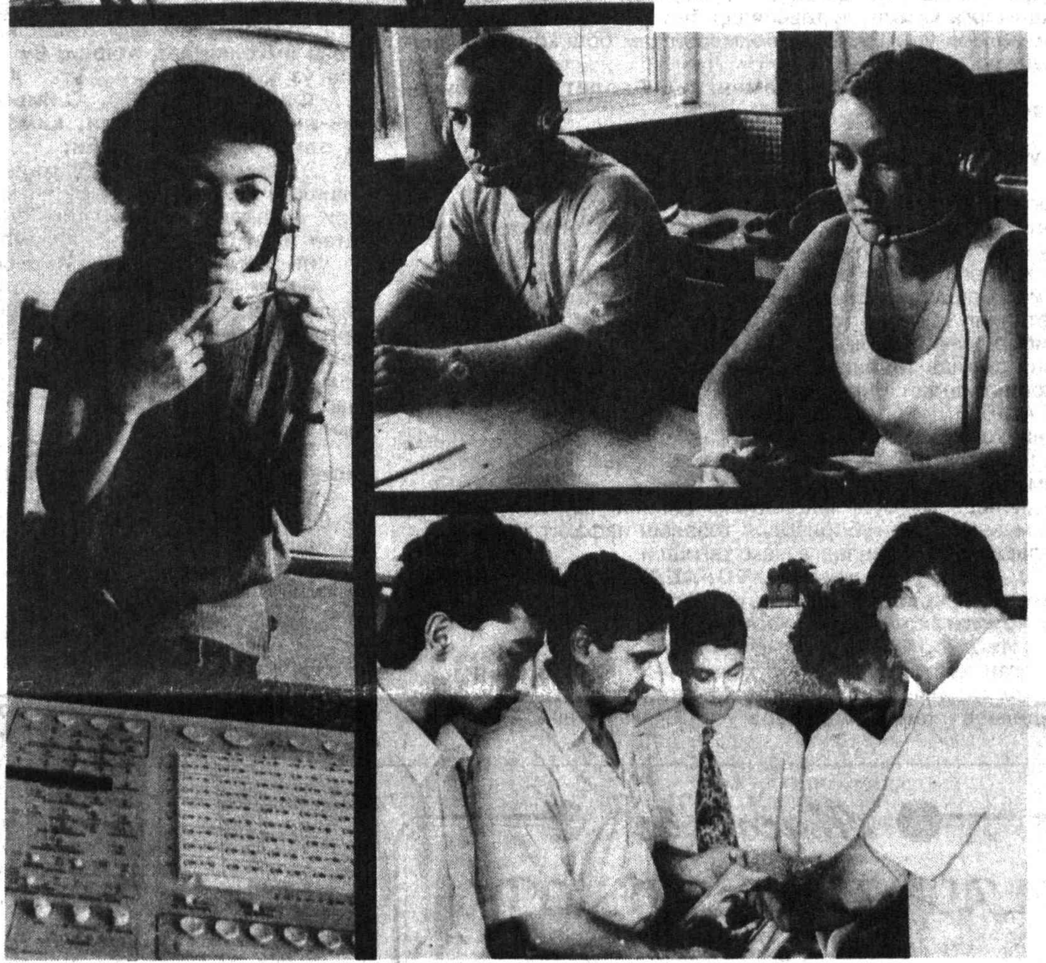
Суратларга: Тошкент Давлат шарқшўнослик институтини талабаларининг ҳаёти акс этган.

Ўтмиш ортдиқолди, боболар ҳаққ, Бу буюк умрда сен энди ўра, Бу юк айландиқанг буюк фарзанди, Икбонг айўпага жонин сарфла, Нозир, Закир, Замон, Сачо Фикратли, Туркий шаҳарнинг навбаси саркан, Бар аср рафтади ухлуданг апар, Қушдек нурпарвар, яшасан Ватан, Нилуфар МАХМУДОВА