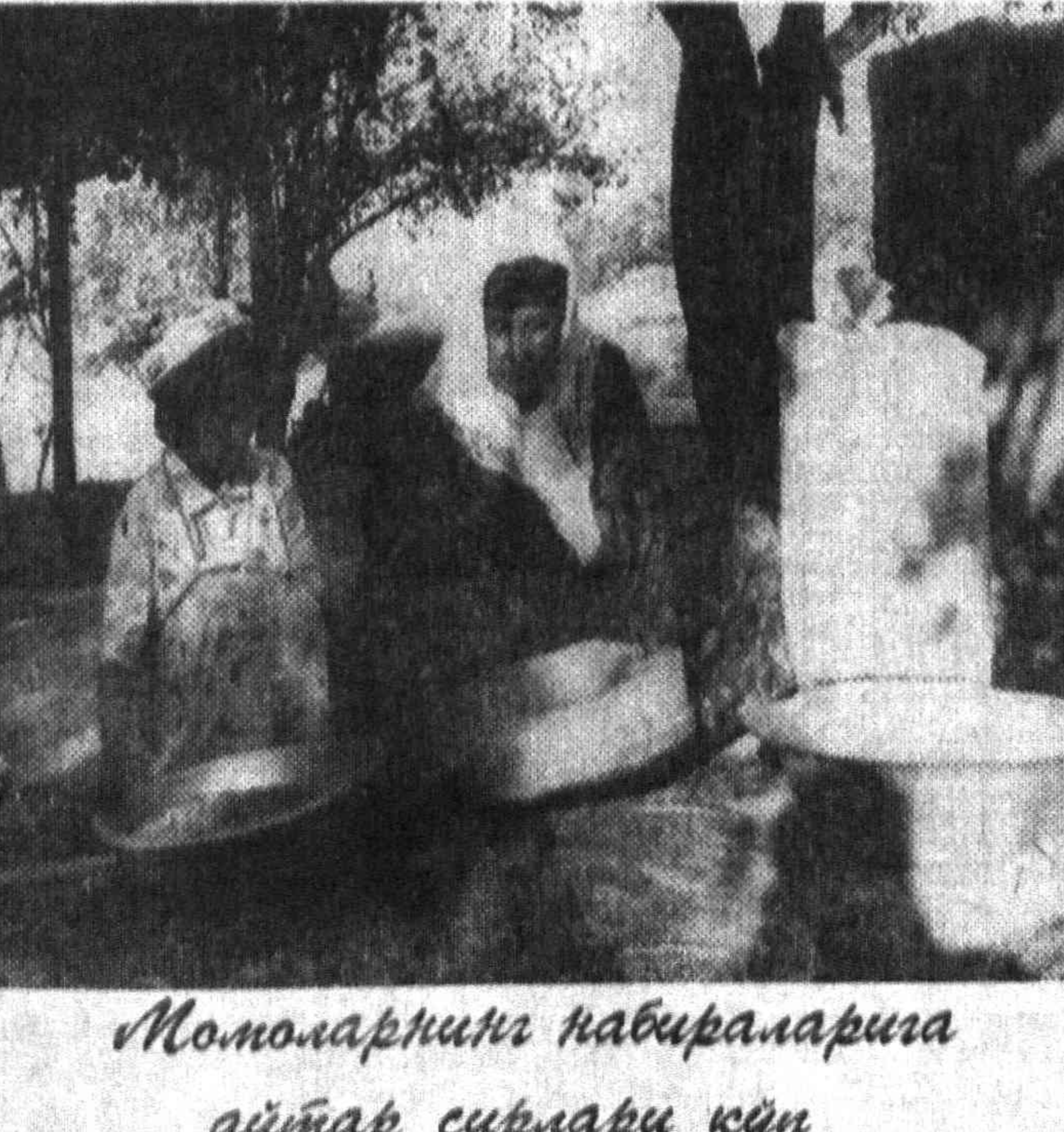
Мотомларнинг навиралирига айтар сирлари кўн

қарич билан ўлмайди. Лекин аслида-чи?... Рақсга бўлиш осон эмас, унинг ҳар бир имосида маъно бўлиши керак. Қуруқдан-қуруқ рақсга тушиш эмас, балки қуй-қўшқача сингиб кетиш, ундаги сеҳрни ҳис қила билиши керак.