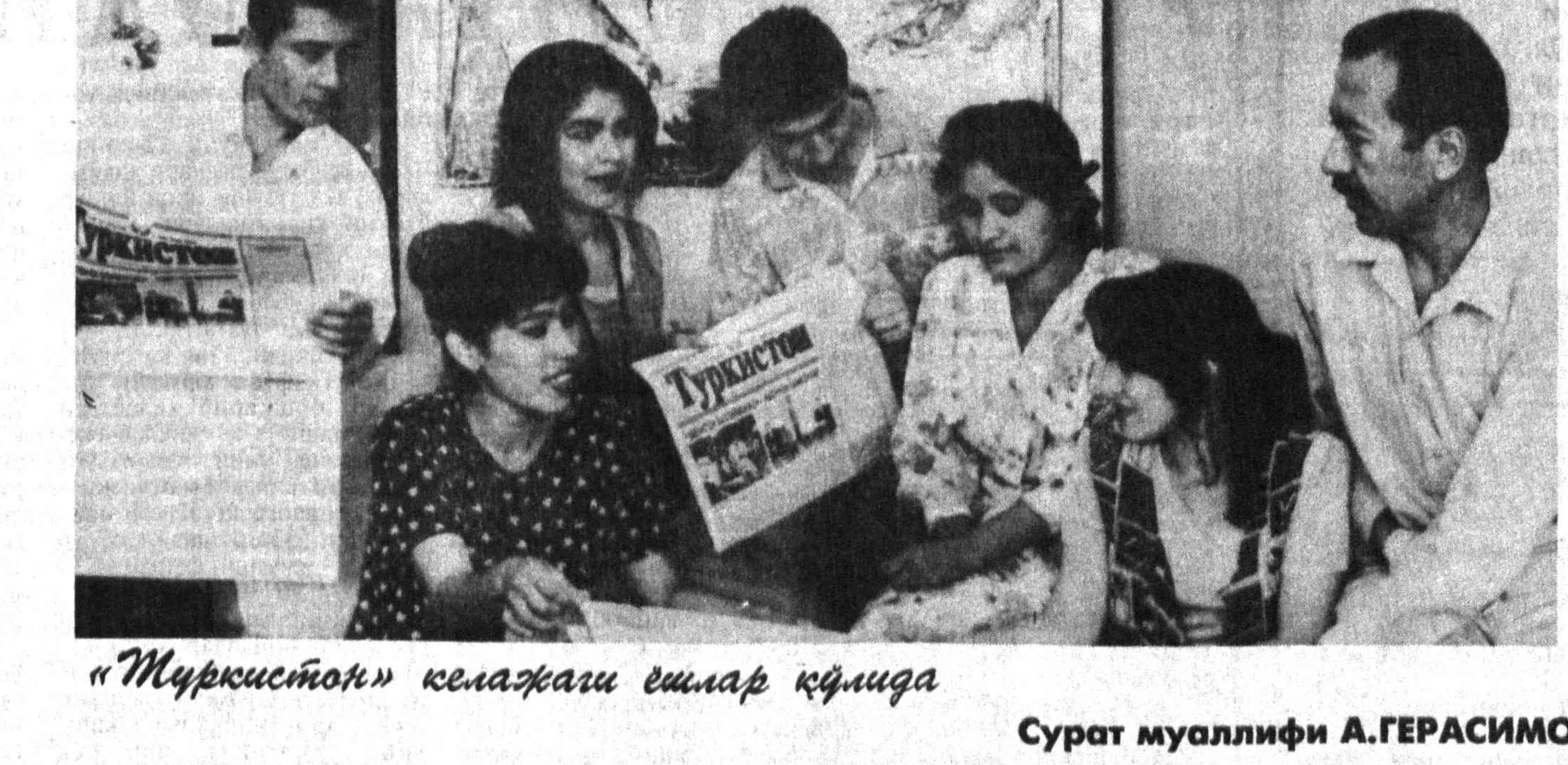
“Туркистон” келажак ёшлар қўлида