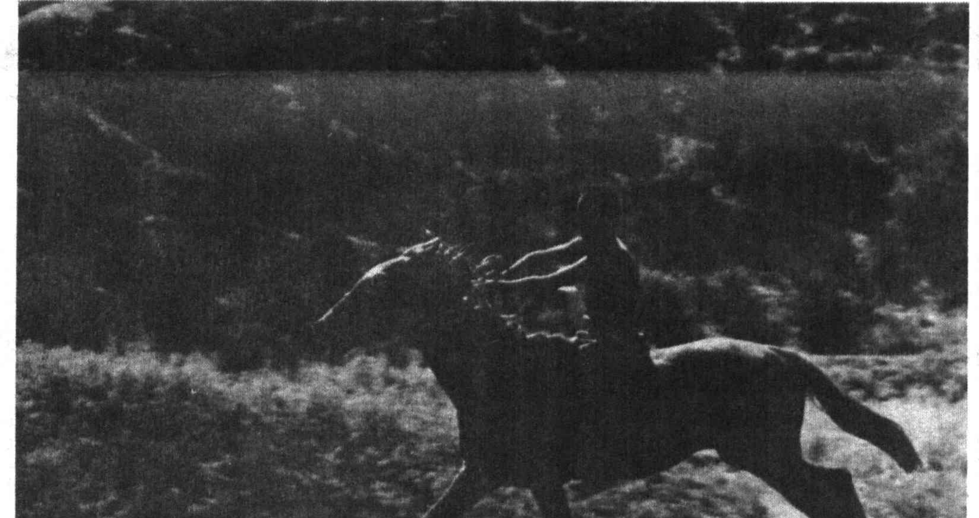
Бизни энди шатон қўйиб ётолмас