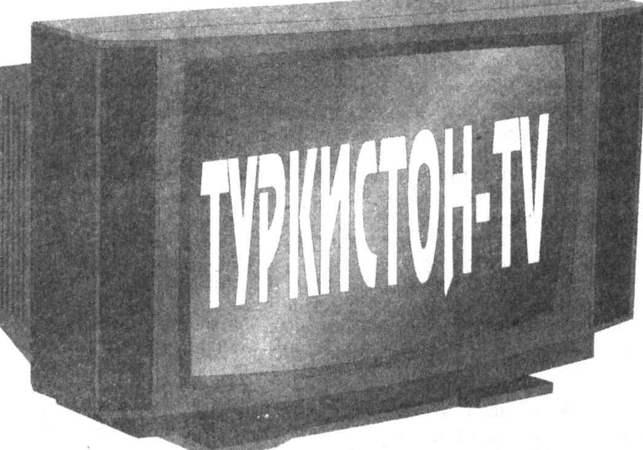
Туркистон ТВ логотиби