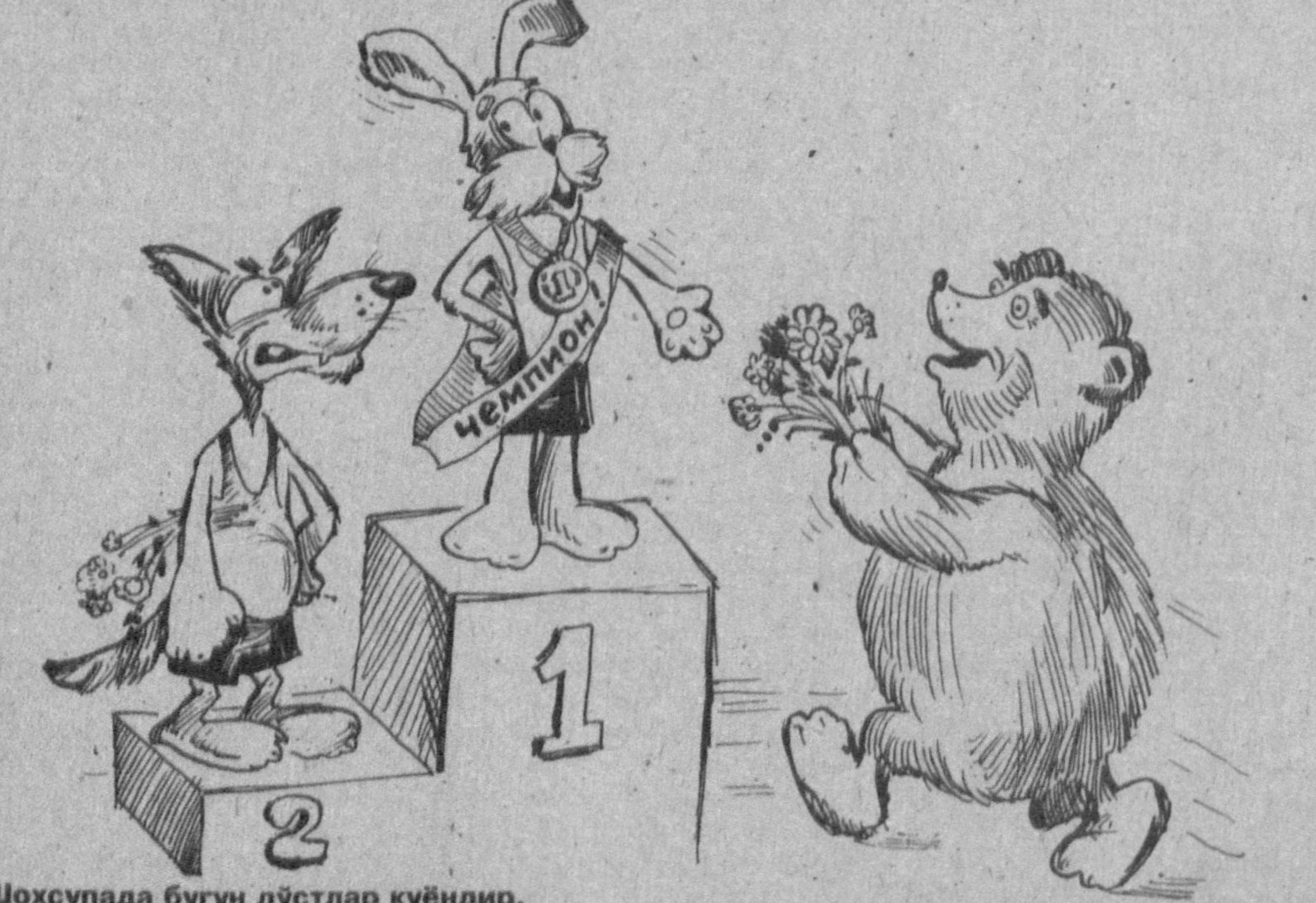
Шоҳсупада бугун дўстлар қуёндир, Қуёнларнинг иши бизга аёндир