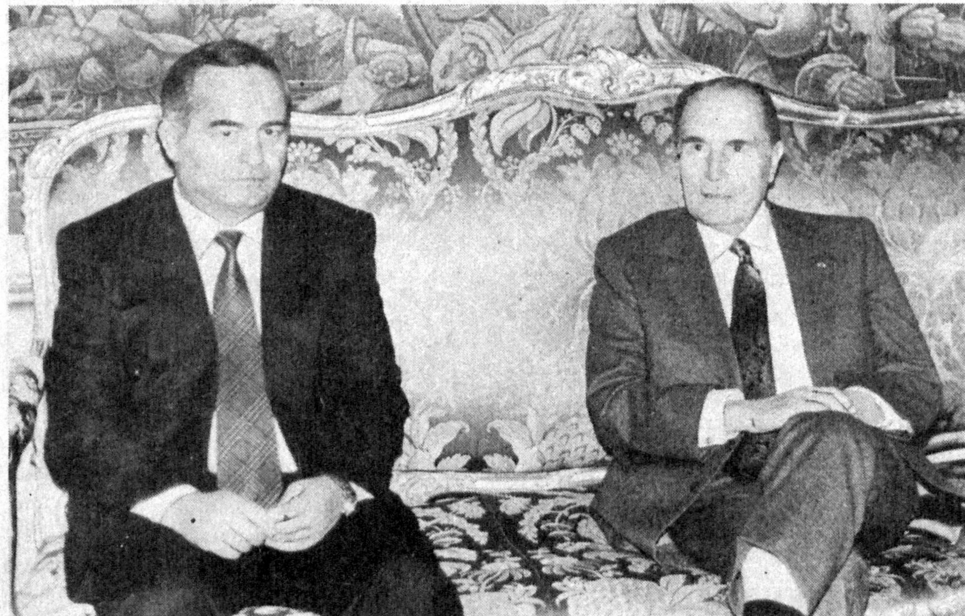
Президентларнинг яқма-яқма суҳбата пайти.