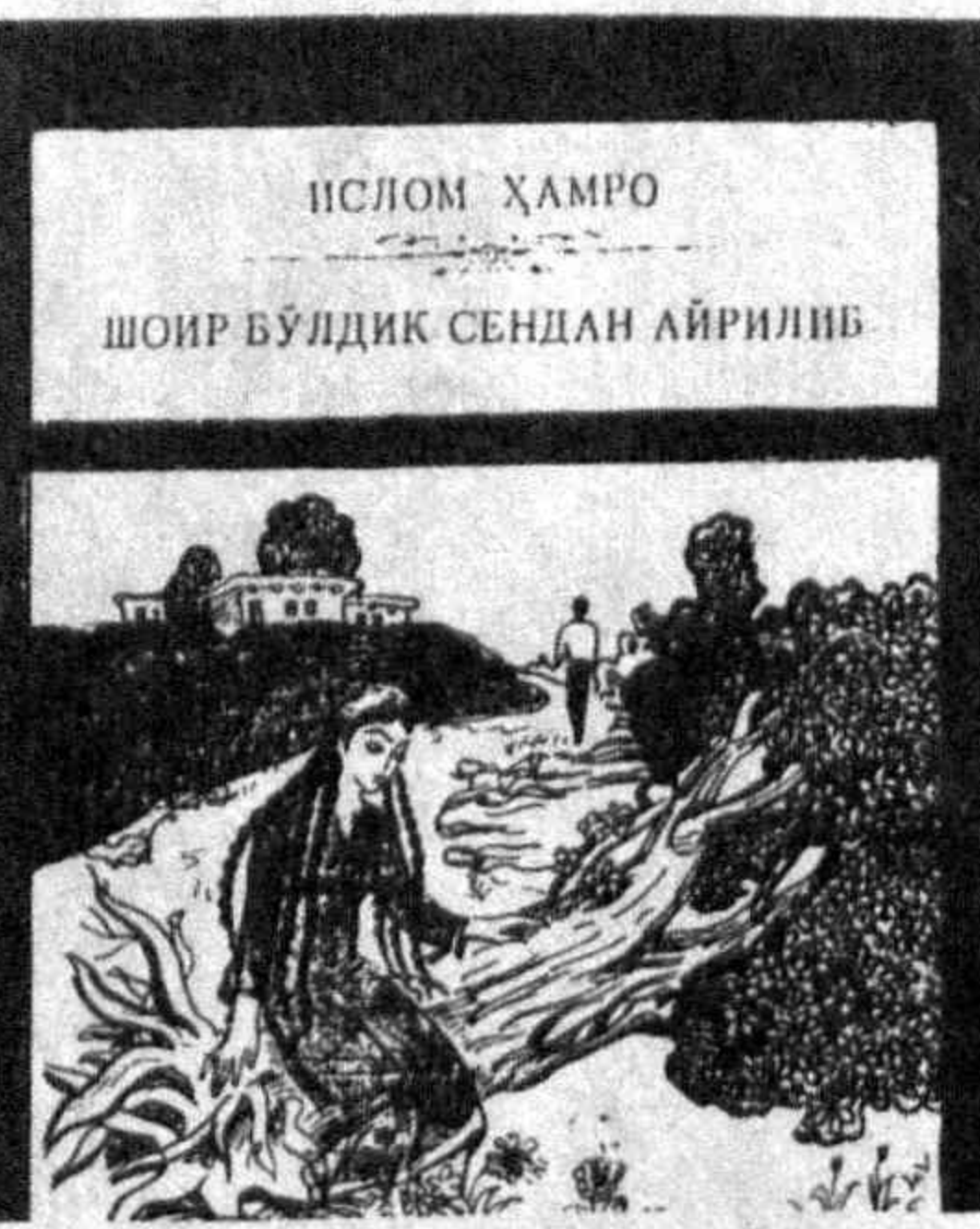
ИСЛОМ ҲАМРО ШОИР БУДИК СЕНДАН АЙРИЛИШ